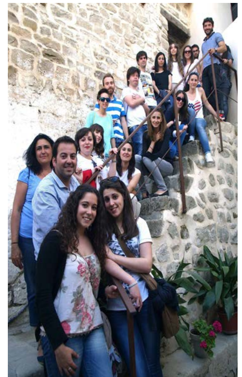
Figura 6. Participantes en las visitas turísticas del programa Abierto por obras .

Las primeras visitas turísticas a la iglesia de San Lorenzo se realizarían ya antes de iniciar las intervenciones, siendo organizadas por la empresa turística Artificios en agosto de 2013, coincidiendo con las fiestas anuales del barrio. Estas visitas se continúan en la actualidad, siendo gestionadas directamente por la Fundación Huerta de San Antonio, tratándose de un recurso económico para sustentar parte de sus gastos y convirtiéndose además en un nuevo atractivo turístico para la ciudad [36] [Fig. 6].