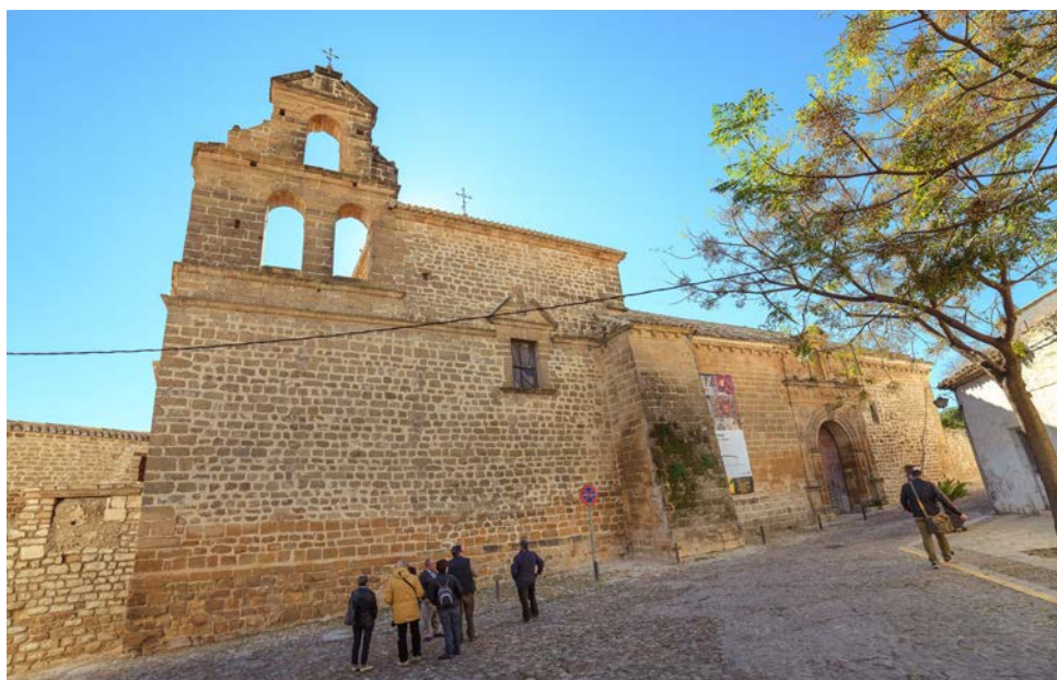
Figura 1. Iglesia de San Lorenzo. Exterior.

Úbeda [Figuras 0 y 1], templo abandonado durante décadas y que se encontraba en avanzado estado de ruina.