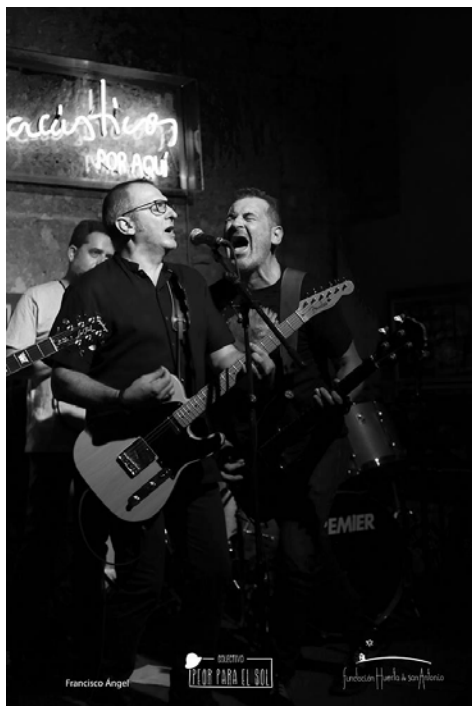
Figura 15. Ciclo de conciertos en la sacristía de la iglesia de San Lorenzo Acústicos por aquí (17 de junio de 2017, concierto de Mardita).