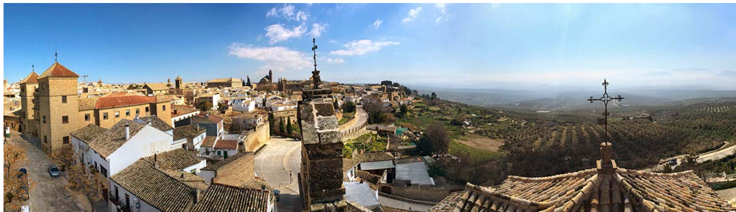
Figura 0. Úbeda desde la espadaña de la iglesia de San Lorenzo.