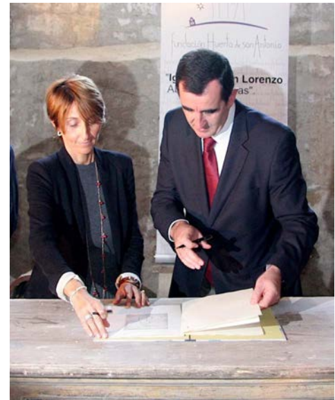
Figura 10. Convenios de la Fundación Huerta de San Antonio con la Escuela de Arte Casa de las Torres y el centro asociado UNED-Úbeda.

El proyecto de obra planteaba la construcción de unos vestuarios en el patio trasero de la vivienda, pero los resultados de los trabajos arqueológicos efectuados en el verano de 2016 por el equipo formado por D. Cristóbal Pérez