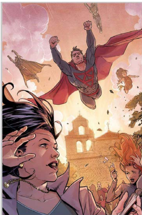
Figura 20. Festival del Cómic Europeo de Úbeda y Baeza. Ilustración original de Xermánico.

Un factor clave ha sido la difusión entre y la cercanía con la población local que es, a la postre, la que disfruta este patrimonio y también la responsable de velar por él. En este sentido, gran parte del mérito de la Fundación Huerta de San Antonio ha sido canalizar las inquietudes sociales y apostar por la cultura y por la educación, logrando de este modo promover medidas para la conservación del patrimonio histórico-artístico de la ciudad. Esperemos que dicha actividad cultural no se detenga sino que incluso se incremente en el futuro, con el fin de hacer realidad la recuperación integral de la «olvidada» iglesia de San Lorenzo.