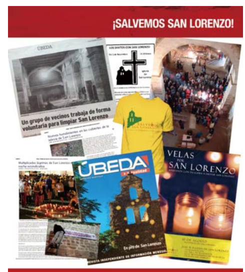
Figura 3. Actos reivindicativos «Salvemos San Lorenzo».

Dos años más tarde surgiría la Plataforma Ciudadana «Salvemos San Lorenzo de su total ruina» que pondría en marcha una recogida de firmas reivindicando la activación de los mecanismos necesarios para garantizar el futuro de San Lorenzo, «haciendo ver que los ciudadanos de Úbeda no están dispuestos a quedarse quietos esperando el día en que el edificio no tenga solución o, de tenerla, resulte demasiado costosa y signifique reinventar una iglesia nueva» [26]. Así, aprovechando las festividades del barrio (10 de agosto de 2012), se celebraría una nueva manifestación reivindicativa denominada Velas por San Lorenzo [Fig. 3]. En la misma, un centenar de personas ataviadas con camisetas amarillas y chapas con el lema «Salvemos San Lorenzo» demostrarían su compromiso y preocupación por el edificio encendiendo un círculo de velas a pie de calle y disponiendo una corona de flores en el templo. De forma paralela se leería un manifiesto expresando la necesidad de activar los mecanismos para garantizar la rehabilitación del edificio y pidiendo al Obispado de Jaén, al Ayuntamiento de Úbeda y a la Junta de Andalucía que asumieran sus responsabilidades para garantizar la correcta conservación del patrimonio histórico-artístico de