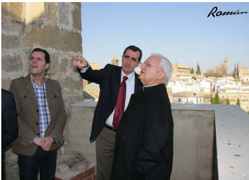
Figura 4. Recepción oficial de la iglesia.

Desde el primer momento de la investigación, y en especial tras el vaciado sistemático de los libros de fábrica, se tuvo la sospecha de que el edificio había padecido graves problemas estructurales —prácticamente de manera crónica— y que las sucesivas obras de consolidación llevadas a cabo en el templo habrían incrementado dichas fallas. Por tal motivo se hizo necesaria la participación de equipos interdisciplinarios con el fin de diagnosticar los problemas existentes y consensuar los objetivos tendentes a su solución. Del mismo modo se potenciaría una organización dinámica y flexible para responder ágilmente a los posibles imprevistos que surgieran (como supuso, por ejemplo, la priorización de las investigaciones arqueológicas del subsuelo y la creación de un equipo de geólogos, químicos e ingenieros tras el descubrimiento de importantes asientos diferenciales en las cimentaciones de los pilares).