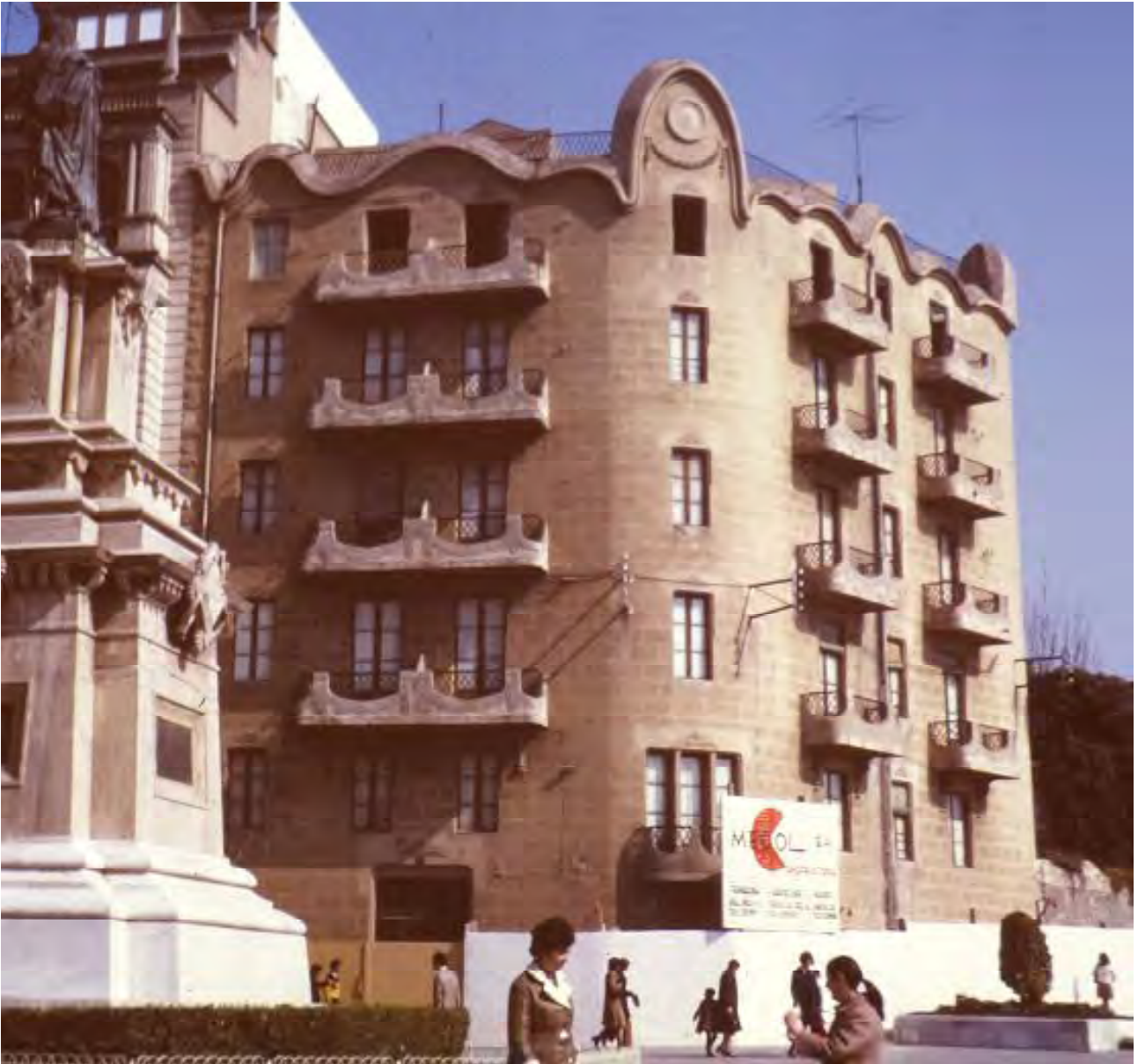
Abril 1975, abans de l'inici de l'enderroc.

La casa es va dir casa Güell, el nom del promotor, que era un conegut metge local. Posteriorment, es coneixia popularment com la casa de la dinamita , perquè Sergi Xirinacs, directiu del negoci dels explosius, hi tenia les oficines i l'habitatge. Aquí hi va néixer, el 1936, l'escriptora i poetessa Olga Xirinacs, premiada amb diferents guardons literaris i distingida amb la Creu de Sant Jordi de la Generalitat de Catalunya (1990).