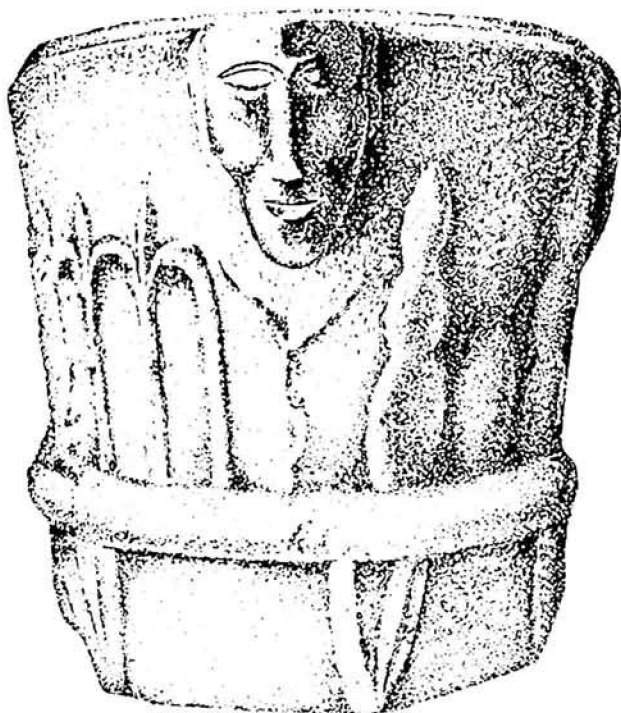
Pila de agua bendita de la parroquia de Formentera