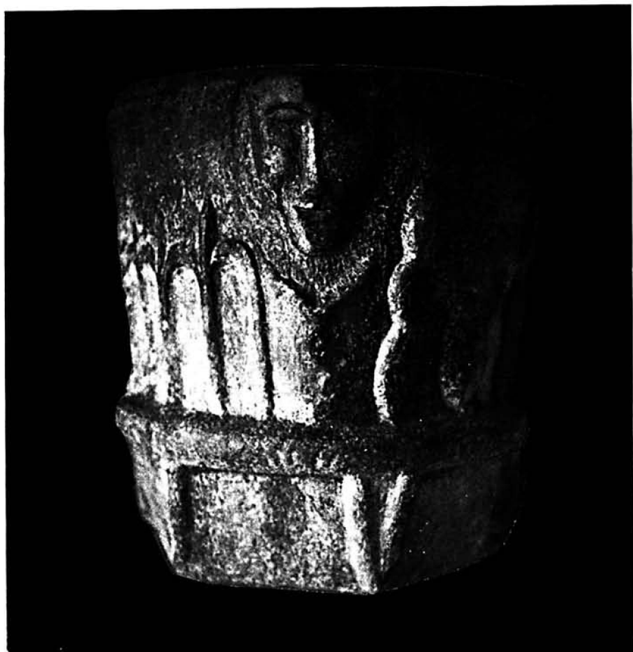
Pila de agua bendita de la iglesia parroquial de Formentera.