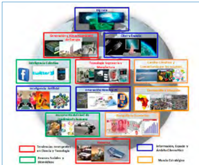
Figura 14. Las doce tendencias analizadas por el Mando de Doctrina de EE.UU. (2017: 3 y ss.).

Se identifican doce tendencias clave que ya están presentes y que continuarán transformando nuestro mundo y el entorno operacional. Estas tendencias están agrupadas en cuatro categorías que son las siguientes: Tendencias emergentes en ciencia y tecnología; Avances sociales y biomédicos; Información, espacio y ámbito cibernético; Y, cambios estratégicos en el mundo. Habrá que esperar a la versión extendida realizada por el MADOD de EE.UU. para conocer aspectos de mayor relevancia.