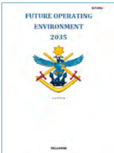
Figura 13. Future Operating Environment: 2035 . Commonwealth of Australia (2016)

con varios departamentos gubernamentales, think-tanks , la Universidad Nacional de Australia y otras instituciones del ámbito de la seguridad no militar. Su finalidad es dar un primer paso en el proceso de diseño de la fuerza, proporcionando respuestas a las preguntas sobre cómo diseñar las Fuerzas Armadas para asegurar la defensa estratégica de Australia.