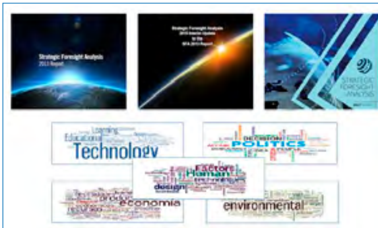
Figura 3. Tendencias mundiales analizadas en los Informes de OTAN 2013, 2015 y 2017

En cuanto a la tecnología se analiza la implicación del dominio de la tecnología por las marcas comerciales así como la dependencia de ciertas tecnologías entre otros factores.