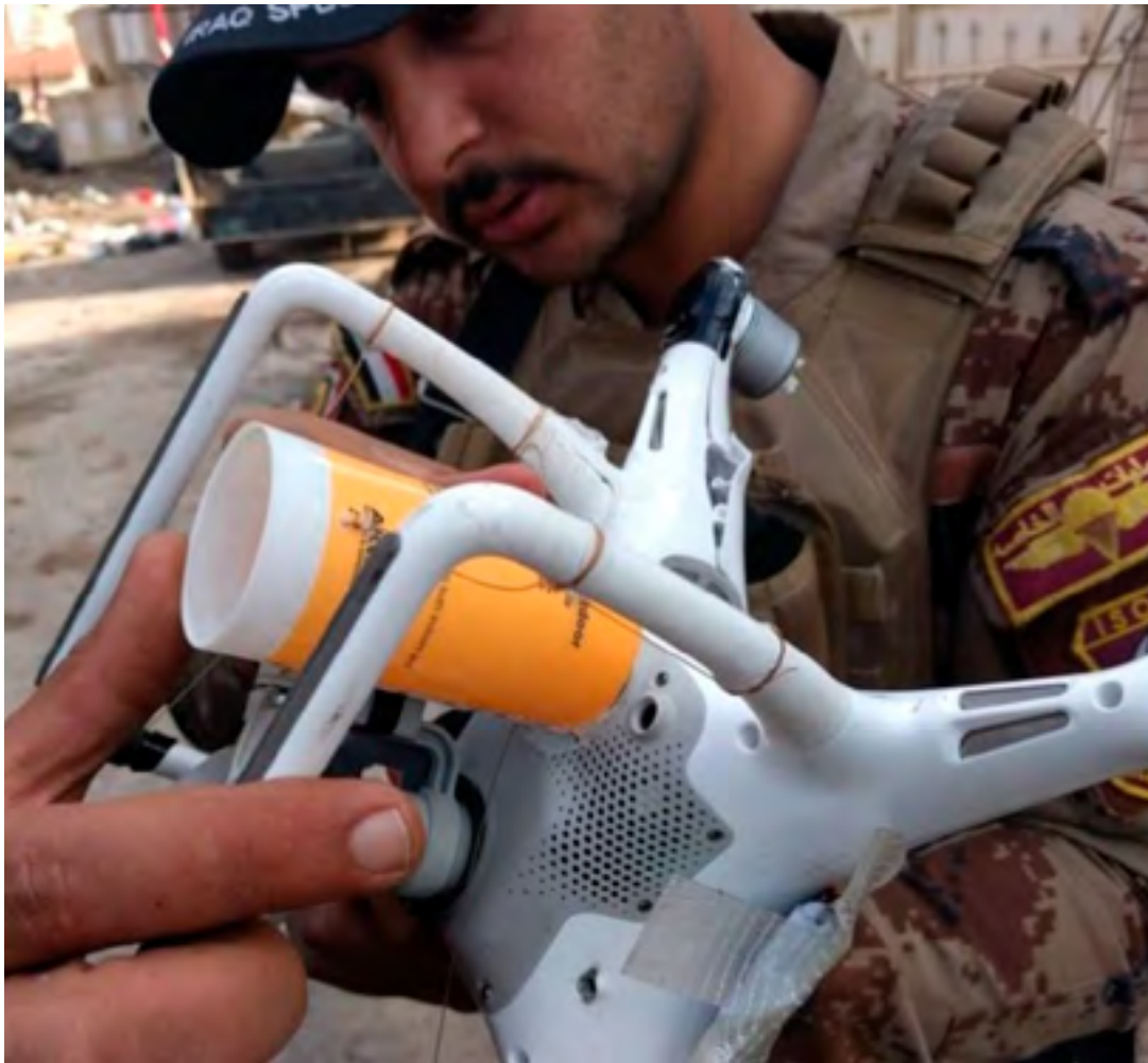
Figura 8: Dron DJI Phantom con sistema de suelta de armamento