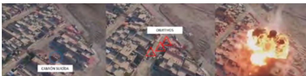
Figura 9: Secuencia de ataque con vehículo suicida y uso de dron 66

El EI vio degradada sus capacidades de ataques suicidas por las acciones tomadas por las Fuerzas de Seguridad Iraquíes, entre otras, por el uso de obstáculos en vías principales, utilización de puntos de control móviles, etc. Es por ello que el EI comenzó a utilizar drones para identificar las rutas más adecuadas para ser utilizadas por sus vehículos suicidas, así como localizar las posiciones enemigas e identificar sus puntos más vulnerables.