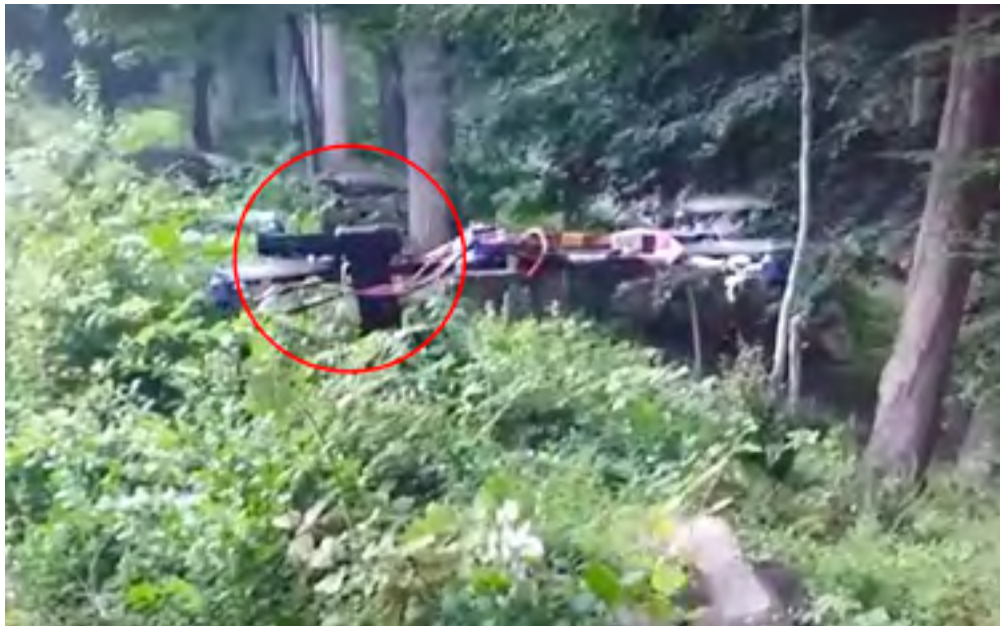
Figura 2: Dron armado con pistola 44