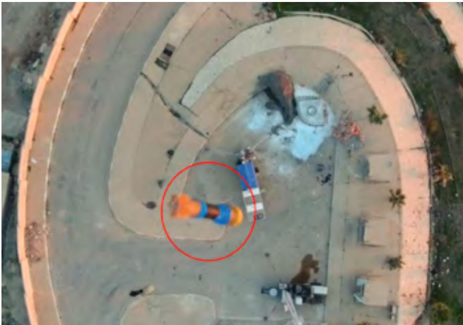
Figura 3: Munición de 40 milímetros modificada lanzada desde un dron, probablemente del tipo HEDP (del inglés High Explosive Dual Purpose ) 46 .