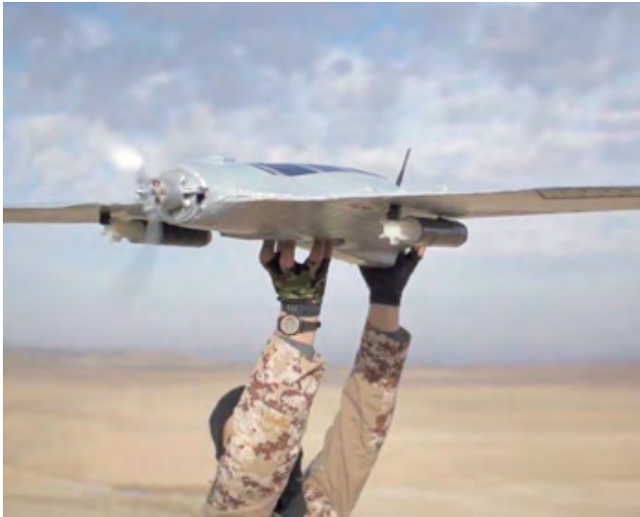
Figura 6: Dron Skywalker X8 equipado con dos armas adaptadas de 40 mm.

El Estado Islámico ha modificado este dron no solo aumentado su rendimiento sino también adaptándole un sistema de suelta de armamento. Se han identificado drones X8 armados con dos bombas de 40 milímetros adaptados en sus alas, incluso drones con hasta cuatro bombas del mismo tipo, dos en cada lado. A su vez, en la gran bodega interna que dispone suelen adaptar explosivos improvisados (IED) con temporizadores, para que detonen si son derribados o capturados.