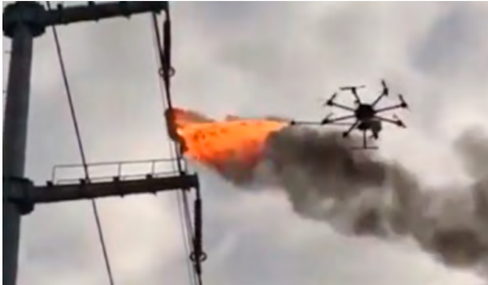
Figura 5: Dron con lanzallamas adaptado para limpieza de tendidos eléctricos

inflamables y utilizarlos en misiones kamikaze. En la web se pueden encontrar infinidad de tutoriales sobre cómo fabricar agentes altamente inflamables como por ejemplo el napalm 52 .