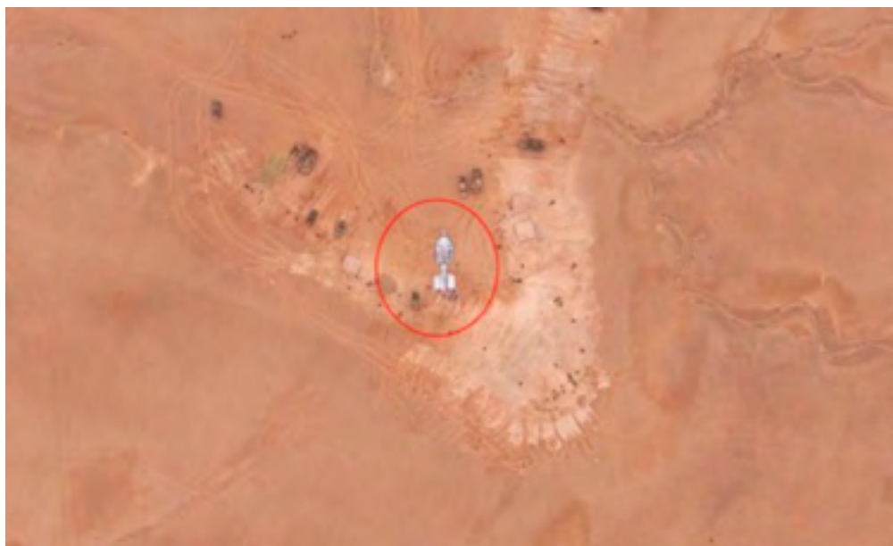
Figura 4: Lanzamiento de granada de mano modificada desde dron 49

El ISIS a su vez utiliza canales de la red Telegram para incluir tutoriales de fabricación de explosivos 50 .