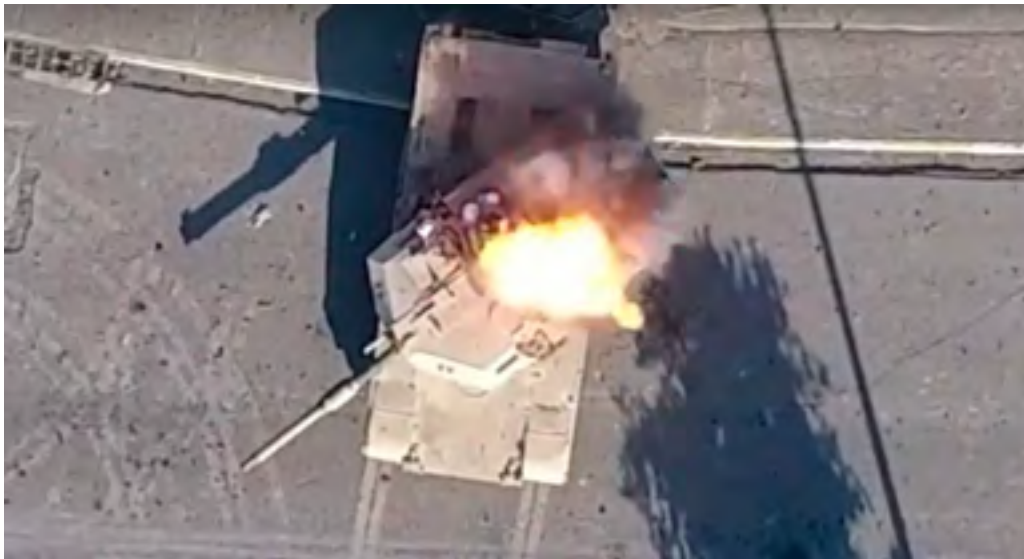
Figura 10: Ataque con dron sobre carro de combate M1A1 iraquí