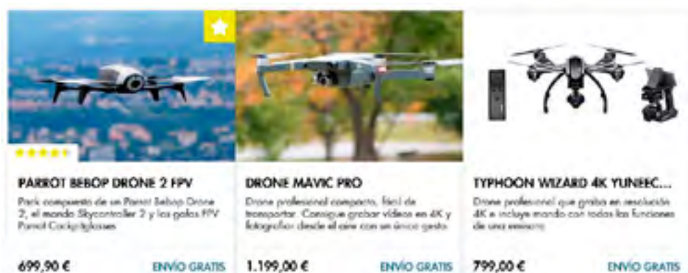
Figura 1: Precio de drones comerciales 28 .