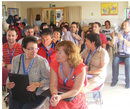
Fig. 25: Ponencia inaugural