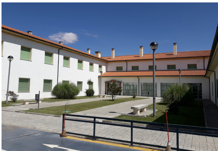
Fig. 5: Residencia del CRIE de Zamora.

Las instalaciones de este centro educativo constan de dos edificios diferenciados: por un lado el aulario (con las aulas, laboratorio, tecnología, informática, biblioteca y las salas de trabajo de los profesores), y, por otro lado el edificio que acoge la residencia (donde están las habitaciones dormitorios, el comedor, la cocina y la sala de usos múltiples). El CRIE cuenta también con diversas zonas ajardinadas y arboladas, un aparcamiento exterior para vehículos, un patio de recreación, una cancha polideportiva, un almacén y una pista de educación vial.