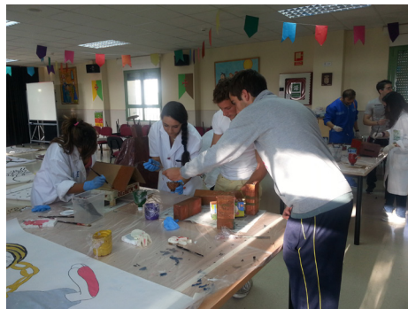
Fig. 21: Trabajando en el proyecto 2014-15.

Finalmente, en los dos cursos siguientes (2015-2016 y 2016-2017) el CRIE de Zamora ha desarrollado un proyecto basado en la cultura, los valores, las tradiciones y la tecnología del mundo oriental, bajo el título “Konnichiwa: metodologías activas a través de las tecnologías y los valores de la cultura oriental” , aplicado con algunas pequeñas variantes en su segunda parte del curso 2016-2017.