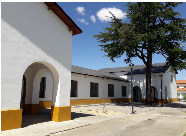
Fig. 6: Aulario del CRIE de Zamora.

A través de este trabajo de historia de la educación se analiza la evolución del CRIE de Zamora durante sus diez primeros cursos de vida académica, desde su creación oficial en el año 2006 hasta el final del curso 2016-2017; dando a conocer sus orígenes legislativos y organizativos, su puesta en práctica, y el desarrollo de las innovaciones educativas llevadas a cabo en el mismo como programa educativo.