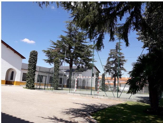
Fig. 1: Panorámica general del CRIE de Zamora.

El Centro Rural de Innovación Educativa de Zamora (CRIE de Zamora) se crea oficialmente mediante ORDEN EDU/1499/2006, de 22 de septiembre (B.O.C.y L. de 28 de septiembre de 2.006), por la que se crean los Centros Rurales de Innovación Educativa de Páramo del Sil (León) y de Zamora, y se dispone su puesta en funcionamiento.