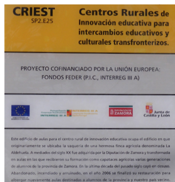
Fig. 3: Proyecto reforma instalaciones.

El CRIE de Zamora ocupa actualmente los edificios en los que originariamente se situaban la vaquería y las dependencias de la finca agrícola denominada “La Aldehuela”. A mediados del siglo XX dicha finca fue adquirida por la Diputación Provincial de Zamora, y se transformó en aulas donde recibieron su formación como capataces agrícolas varias generaciones de alumnos (principalmente de la provincia de Zamora). En la última década del pasado siglo cayó en desuso, abandonado, incendiado y arruinado. En el año 2006 se finalizó su restauración para albergar nuevamente aulas destinadas al centro de innovación para alumnos de la provincia de Zamora y para intercambios culturales transfronterizos.