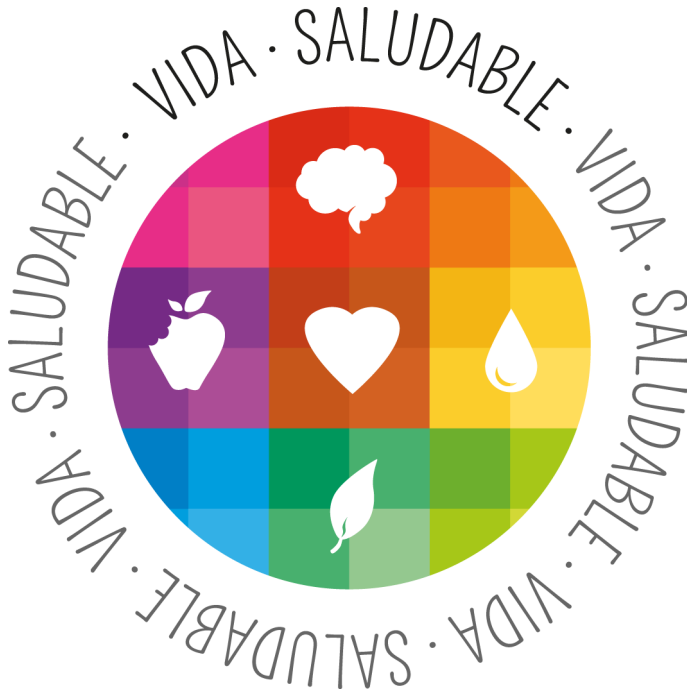
Fig. 8: Logotipo oficial MECD distintivo de calidad “Sello Vida Saludable”.

Resolución del 23 de diciembre de 2015, y de acuerdo con la propuesta formulada por la comisión evaluadora al respecto.