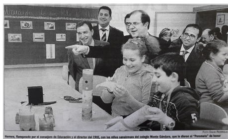
Fig. 24: Foto de “La Opinión de Zamora” 20/2/2008.