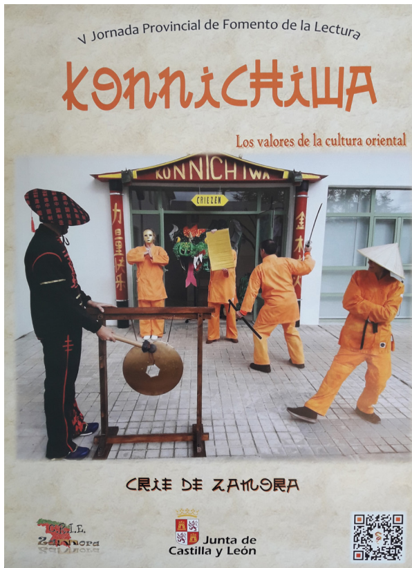
Fig. 22: Cartel “Konnichiwa” para la V Jornada Provincial de Fomento de la Lectura.

Este planteamiento pretendió impregnar de esos valores y recursos (también tecnológicos) a nuestros alumnos, para compensar carencias observadas en el desarrollo de la convivencia, junto al respeto y la responsabilidad (individual y grupal) tan presentes en las rutinas que se llevan a cabo en las semanas de participación. Aspectos que cada vez son más necesarios en los entornos de aprendizaje de los alumnos que acuden al CRIE de Zamora.