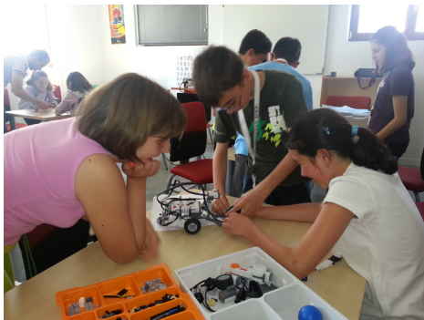
Fig. 18: Taller de Robótica en “Profundiza”.