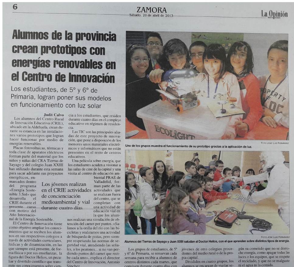
Fig. 13: Artículo “La Opinión de Zamora” sobre los prototipos de energías sostenibles.

Asimismo, los alumnos proyectaron y elaboraron un prototipo energético real por equipos, en función de la patrulla sostenible que les fue adjudicada, como dinámica de historia general para liberar al Dr. Helios (ver fig. 13).