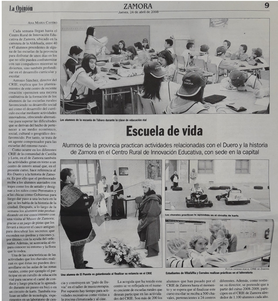
Fig. 7: "Escuela de Vida": Artículo sobre el CRIE en La Opinión de Zamora, 24-4-2008.