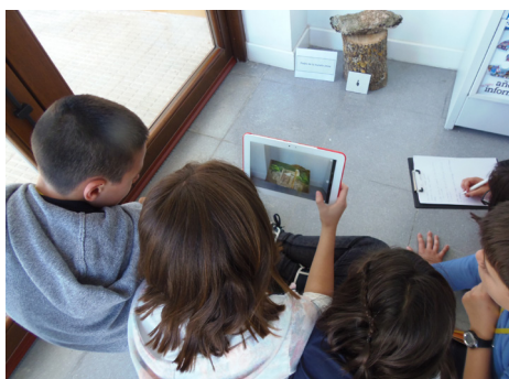
Fig. 11: Alumnos trabajando con “tablets”.

Por otro lado, las pizarras digitales interactivas y los aparatos tecnológicos (como los dispositivos de evaluación “activexpression”, los ordenadores portátiles convencionales, las cámaras digitales y otros elementos audiovisuales) continúan siendo recursos muy importantes en el desarrollo de las actividades.