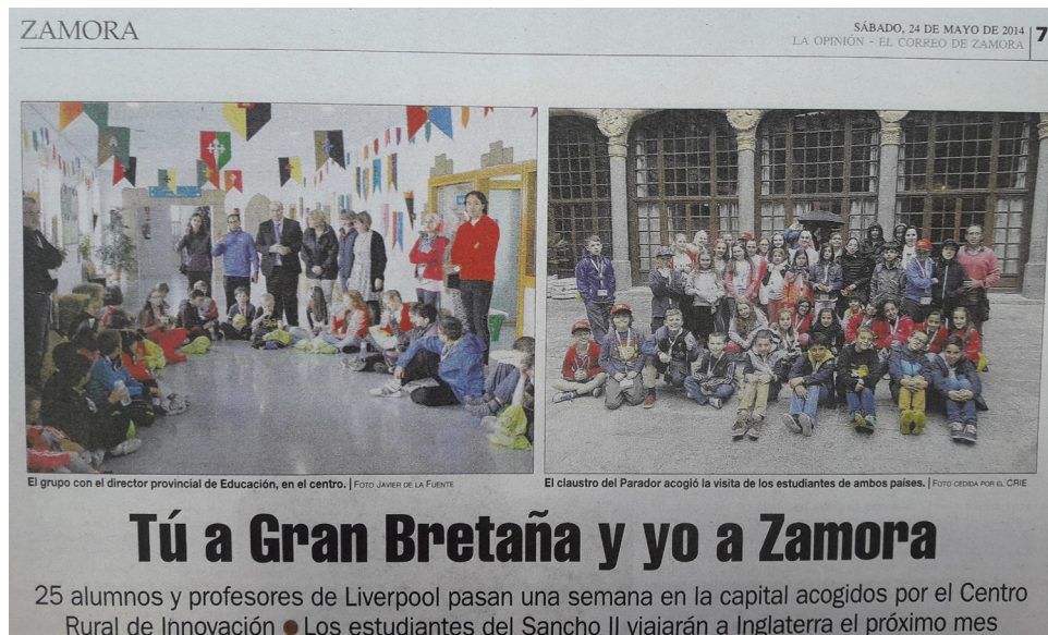
Fig. 12: Artículo de “La Opinión de Zamora” sobre la Convivencia Internacional 2014.

Asimismo, se ha puesto el énfasis en la elaboración de un menú saludable (en función del centro de interés pertinente, y de acuerdo con el distintivo de calidad “Sello Vida Saludable” otorgado por el MECD en el año 2016), en coordinación con la empresa encargada del comedor del CRIE de Zamora, y estableciendo actividades transversales específicas de alimentación y hábitos saludables.