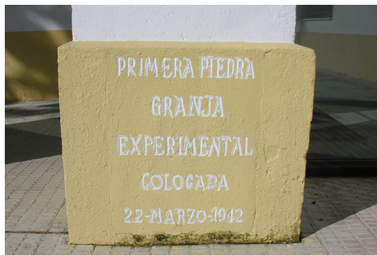
Fig. 2: Primera piedra Granja Escuela.