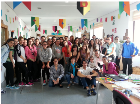
Fig. 20: Grupo 2.º Grado Educación Infantil.