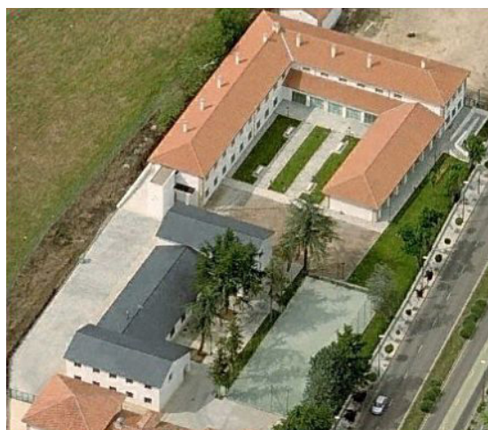
Fig. 4: Ubicación del CRIE de Zamora en la Finca “La Aldehuela” de la capital.

El CRIE de Zamora ocupa actualmente los edificios en los que originariamente se situaban la vaquería y las dependencias de la finca agrícola denominada “La Aldehuela”. A mediados del siglo XX dicha finca fue adquirida por la Diputación Provincial de Zamora, y se transformó en aulas donde recibieron su formación como capataces agrícolas varias generaciones de alumnos (principalmente de la provincia de Zamora). En la última década del pasado siglo cayó en desuso, abandonado, incendiado y arruinado. En el año 2006 se finalizó su restauración para albergar nuevamente aulas destinadas al centro de innovación para alumnos de la provincia de Zamora y para intercambios culturales transfronterizos.