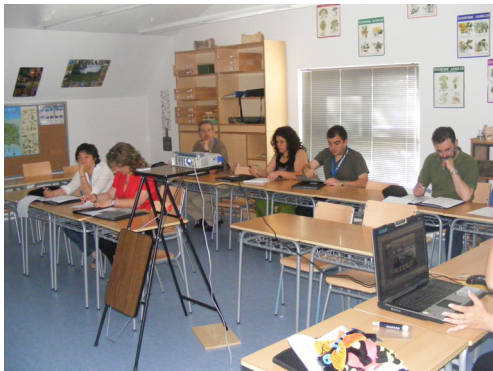
Fig. 26: Momento de comunicaciones: experiencias.