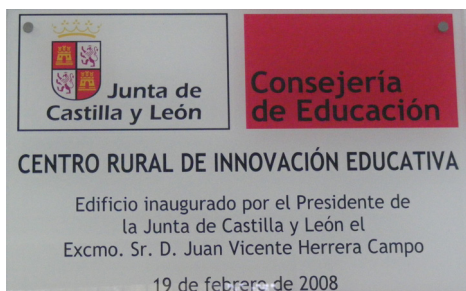
Fig. 23: Placa conmemorativa.