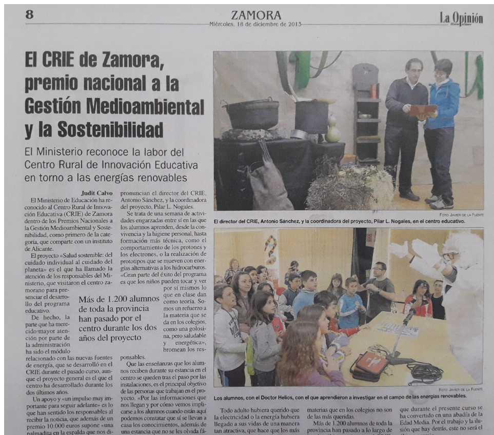
Fig. 29: Artículo de “La Opinión de Zamora” –18/12/2013– sobre Premio Nacional.