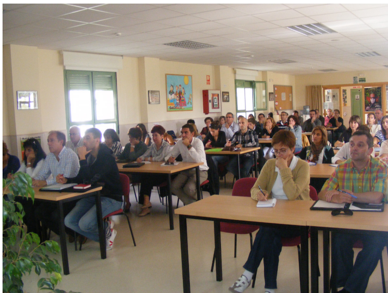
Fig. 28: Reunión de Directores en la sala de usos múltiples del CRIE de Zamora.

Convocadas, organizadas y dirigidas en la práctica por los responsables de la Dirección Provincial de Educación de Zamora.