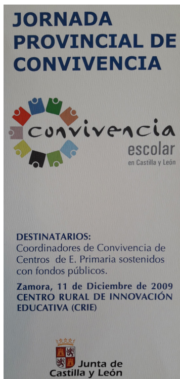
Fig. 27: Cartel Jornada Provincial de Convivencia.