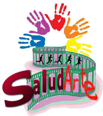
Fig. 14: Logo proyecto “SaludArte”.

El Equipo Pedagógico del CRIE integró los planes de actuación “ SaludArte ” y “ Energía Sostenible 3.Sol ” (correspondientes a los curso 2011-2012 y 2012-2013 respectivamente) en el Proyecto de Innovación Educativa (P.I.E) “ Salud sostenible: Del cuidado individual al cuidado del planeta ”, aprobado por el Servicio de Innovación Educativa de la Consejería de Educación (mediante Resolución de 21 de junio de 2012 ) para desarrollarse durante los mencionados cursos académicos.