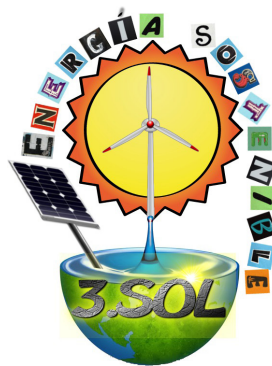
Fig. 15: Logo “Energía Sostenible 3.Sol”.

La salud individual y colectiva, junto al respeto del medio ambiente de nuestro planeta Tierra, constituyen aspectos fundamentales en el desarrollo humano, y el equipo pedagógico del CRIE de Zamora consideró que deberían estar presentes en sus procesos de enseñanza-aprendizaje de dicho proyecto de innovación educativa.