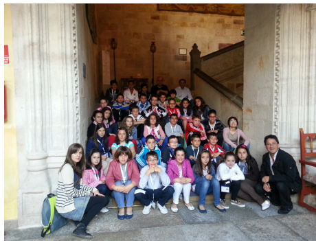
Fig. 19: Actividad didáctica en el Parador.

Un resumen de todo lo realizado en este programa de “ Profundiza ”, con imágenes y vídeo, puede visionarse en la página web del CRIE de Zamora en el siguiente enlace: