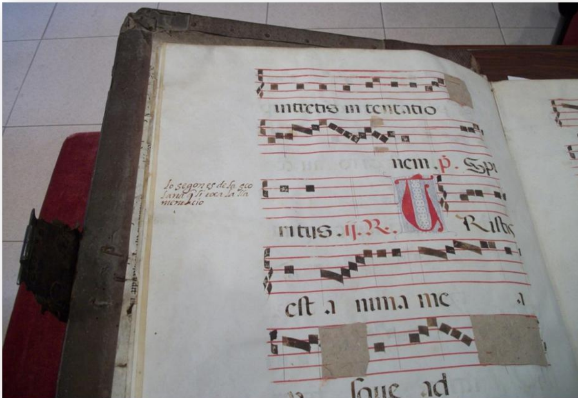
Ilustración 1. Antifonario del siglo XVI perteneciente al Monestir de Sant Pere de les Puel·les. Contiene abundantes signos de uso. Barcelona, Arxiu històric del Monestir de Sant Perre de les Puel·les, Col·lecció de cantorals, núm. 4.