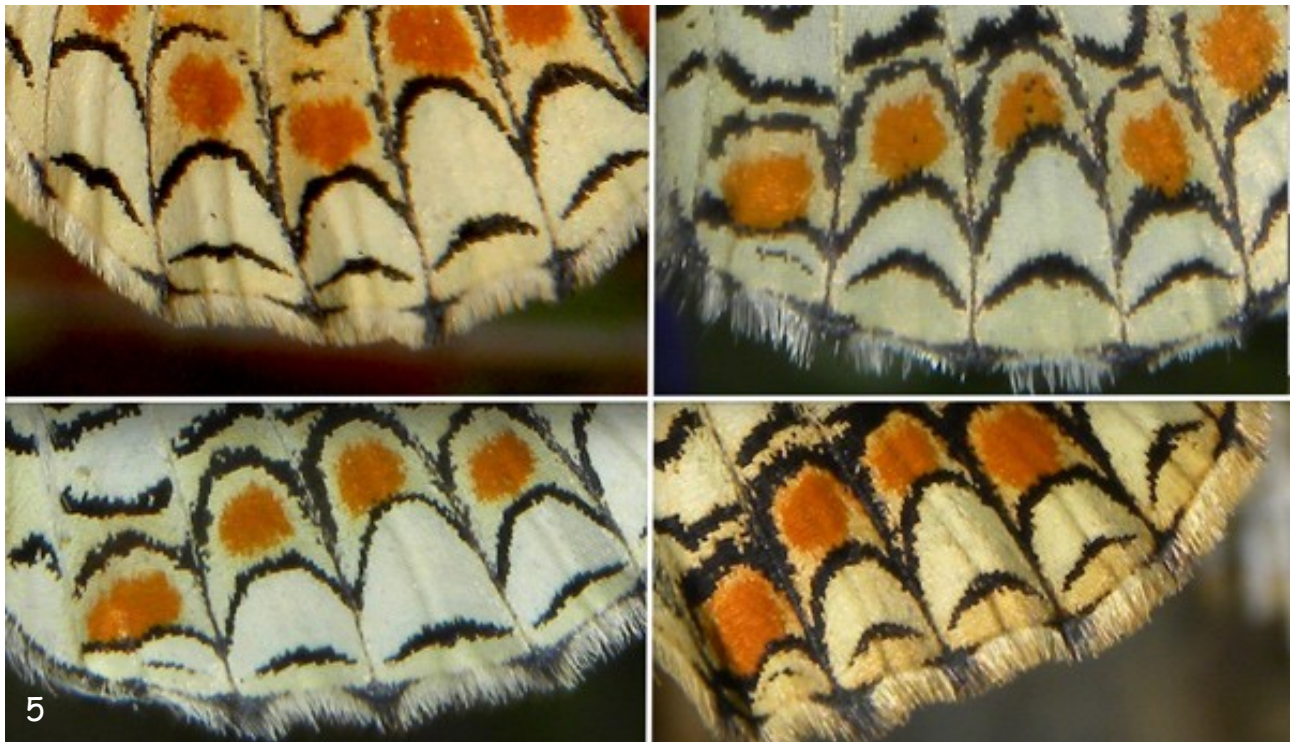
Fig. 5. - Detalle del reverso del ala posterior de M. phoebe (izquierda) y M. ornata (derecha).