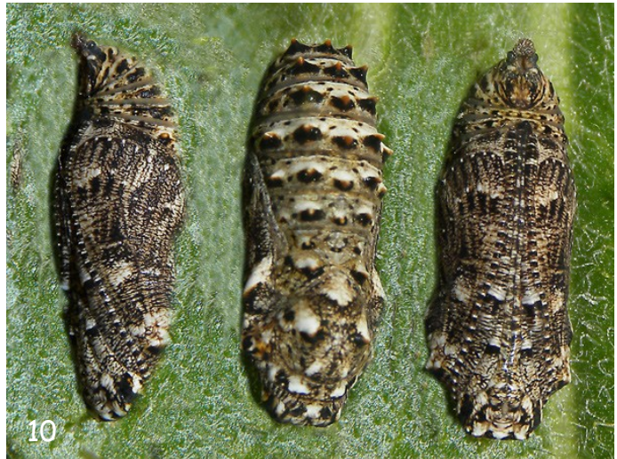
Fig. 10. - Pupa de M. ornata (Beas, Granada, V/2013).