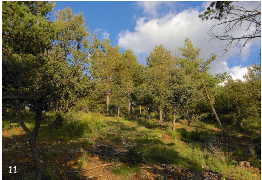
Fig. 11. - Hábitat de M. ornata en Monachil, Sierra Nevada, Granada.