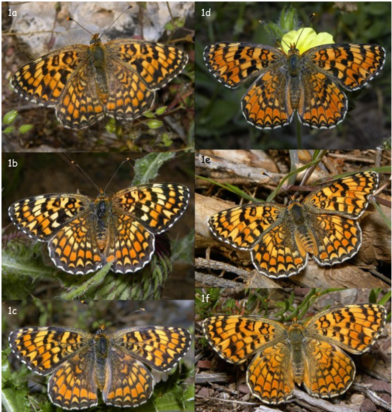
Fig. 1. - Habitus de Melitaea ornata y Melitaea phoebe .

Columna izquierda: Melitaea ornata , ex-larvae. a.- ♀ (Baza, Granada, VI/2013). b.- ♀ (Güéjar-Sierra, Granada, VI/2013). c.- ♀ (Baza, Granada, VI/2013).