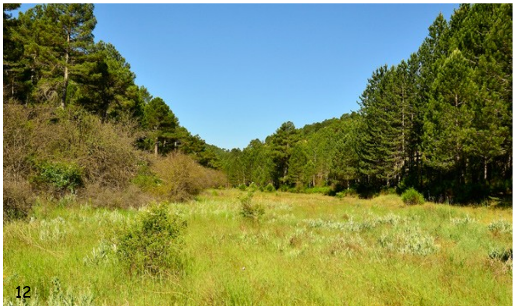
Fig. 12. - Hábitat de M. ornata en la Sierra de Alcaraz (Albacete) observándose manchas de Cirsium pyrenaicum de hojas grisáceas.