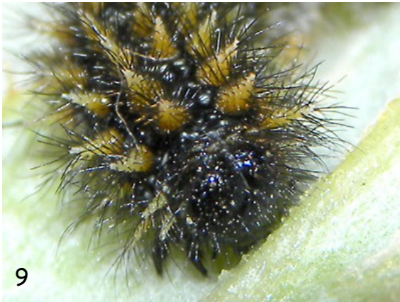
Fig. 9. - Oruga de M. ornata (Monachil, Sierra Nevada, 13/IV/2013).