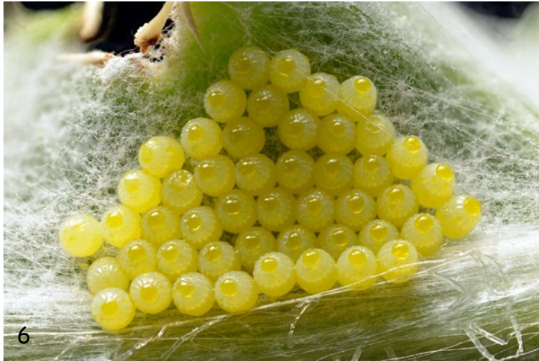
Fig. 6. - Puesta de huevos de M. ornata sobre Cirsium pyrenaicum (Sierra de Alcaraz, Albacete, 4/VI/2017).