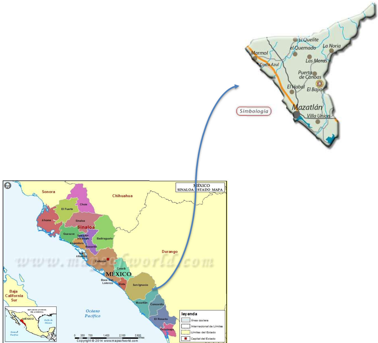
.Figura 2: Municipio de Mazatlán