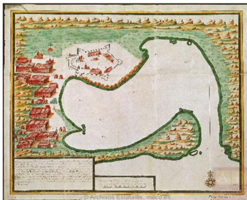
Imagen 3. Plano del puerto de Acapulco y Fuerza de San Diego, en la costa del mar del sur de la Nueva España.

Por otra parte, el mundo asiático comenzaba en la Nueva España, específicamente, en el puerto de Acapulco, el cual hacia 1573 emergió como el principal de la fachada pacífica, obteniendo a finales del siglo XVI el monopolio de las relaciones entre el occidente hispánico y Asia. Pues, este puerto se encontraba más cerca de México y Veracruz, lo cual facilitaba la redistribución de los productos asiáticos con destino a la capital novohispana y a Sevilla (Jacquelard, 2015, p. 192).