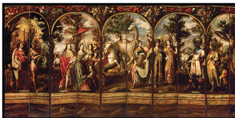
Imagen 1. "Las cuatro partes del mundo", biombo del pintor novohispano de origen mulato Juan Correa (XVII).

Nueva España existía una circulación planetaria que la llevó a construir una modernidad americana, en donde la capital novohispana emergió como una ciudad cosmopolita (Gruzinski, 2004, p. 87), con una producción iconográfica e intelectual que dio origen a las primeras obras del pensamiento moderno americano 4 , el cual se distingue de aquel producido en Europa por poseer una mirada global del mundo que estuvo influenciado por la Monarquía Católica (Gruzinski, 2017, p. 233). Por otra parte, la Nueva España, como territorio conectado a cuatro continentes, produjo sus propias dinámicas sociales y económicas internas, como parte de una originalidad americana, y en este caso, novohispana. (Chakrabarty, 2000)