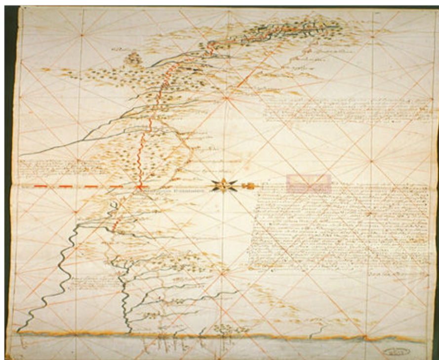
Imagen 4. Dibujo del camino proyectado desde San Juan de Ulúa y las ventas de Buiron hasta México.