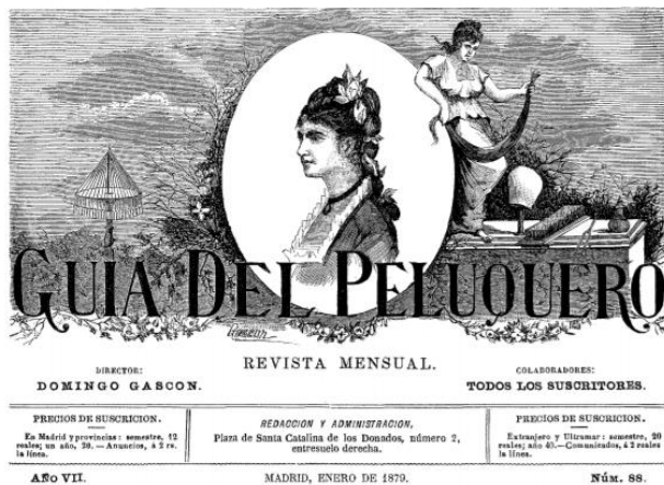
Portada del número ochenta y ocho (enero de 1879) de la Guía del peluquero

A partir del año VII y del número 88, de enero de 1879, se incorpora a la cabecera la imagen grabada de una dama con un hermoso peinado que va enmarcada en un medallón, a cuyo lado hay una mujer vestida al modo clásico que sujeta un largo mechón de pelo. También aparece un pequeño bodegón de objetos de peluquería y abajo del todo, discretamente, aparece la firma de Gascón que era el director y creador de la revista y al que parece plausible atribuir el diseño de la imagen.