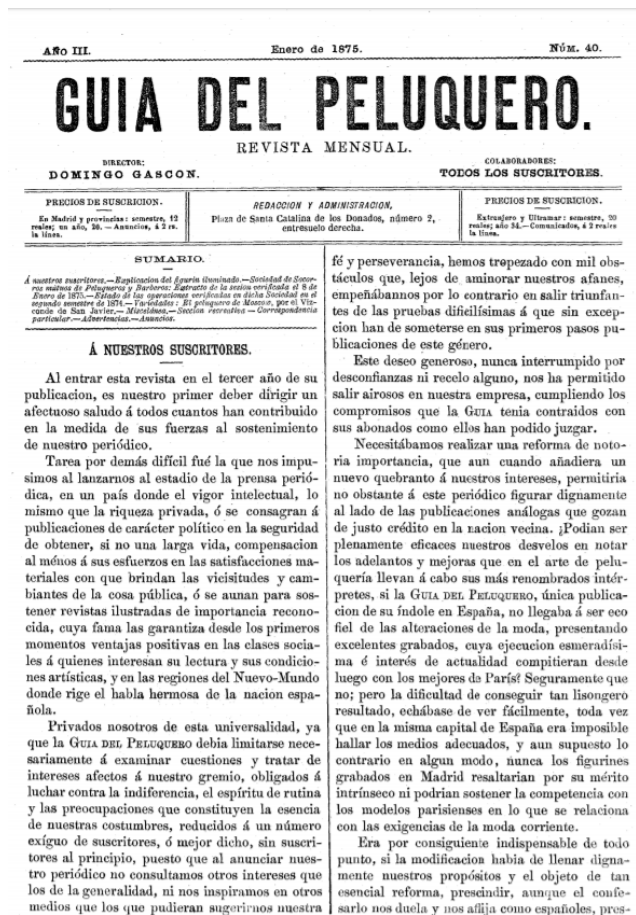
Portada del número cuarenta (enero de 1875) de la Guía del peluquero

El título de la cabecera en su primer número, del uno de enero de 1873, era Guía del peluquero y barbero . No llevaba subtítulo, informando únicamente de que era una revista quincenal. Cabe mencionar que en los tomos que abren la colección encuadernada se señala en el que engloba el primer año que está “dedicada exclusivamente á defender los intereses y procurar el progreso de la clase que representa”. Ese lema también se repite en el tomo del año II aunque el subtítulo de revista quincenal pasa a ser mensual a partir de marzo de 1874, en el número 30.