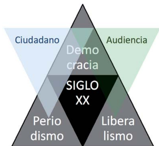
Figura 3. Modernidad, ciudadano y audiencia

Fuente: Elaboración propia. El sujeto moderno se desdobra en ciudadano y audiencia, iniciando la (pos-moderna) problemática mediática, social y política de la ambigüedad del Ser.