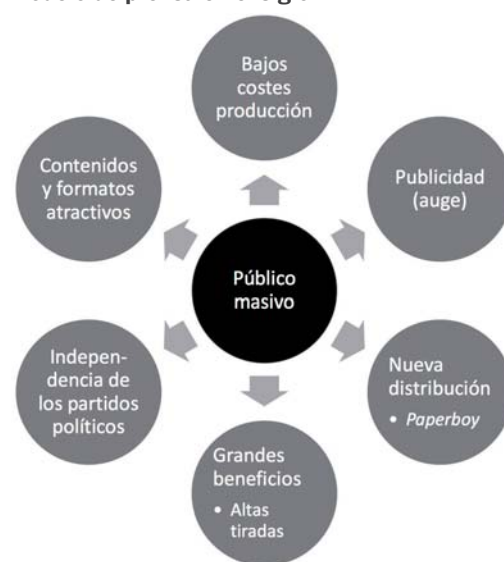
Figura 2. Características principales del nuevo modelo de prensa en el siglo XX

El público masivo se debería al aumento del sufragio 19 . Además, es necesario resaltar la decadencia del servicio por suscripción en la época, puesto que la venta principalmente se hace en la calle a través de los vendedores callejeros. Por último, esta prensa de inicios del XX se libera de la dependencia de los partidos políticos para sustituirlos por los anunciantes. Los periódicos ofrecen información política pero no son partidistas.