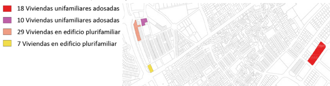
Mapa 2: Conjuntos de vivienda totalmente vacíos

Respecto a las viviendas plurifamiliares encontramos, al contrario que en las unifamiliares, una mayor concentración entre las más nuevas, localizadas en las zonas de nuevo crecimiento del municipio. De esta forma en la localidad aparecen 118 viviendas con menos de 10 años y 74 con menos de 20, concentradas principalmente en la zona de la Universidad y las Tinajuelas (con presencia puntual en otras zonas de nuevo crecimiento). Son menores las cifras para vivienda más antigua, en este caso ligada nuevamente al centro. Así encontraremos 18 viviendas con menos de 30 años, 31 entre 30 y 50 y solo 3 viviendas con más de 50 años.