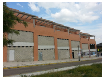
Imagen 2.