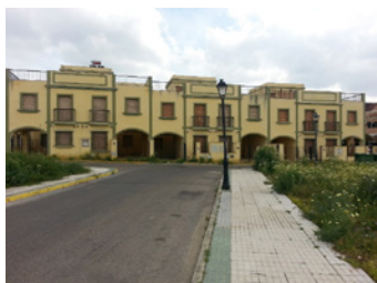
Imagen 1. Elaboración propia