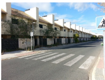
Imagen 3. Elaboración propia