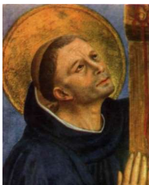
Santo Domingo de Guzmán (1170–1221), burgalés, fundador de la Orden de los Predicadores, con una, incluso de medio perfil, muy visible tonsura de San Pedro.

La denominación, por tanto, alude directamente al primer Papa de Roma y en la razón de ello se encuentra, con casi total certeza, el origen de la tradición que venimos indagando, pues la tonsura de San Pedro evoca y homenajea un episodio narrado en una de las fuentes más caudalosas de las tradiciones populares de la cristiandad: la «Leyenda Dorada» o Legenda aurea en latín, lengua en la que el arzobispo de Génova, el dominico Santiago de la Vorágine o Jacopo de' Fazio o da Varagine (1228–1298) en su italiana versión —nacido en la actual Varazze, en la costa de Liguria— había recogido a mediados del s. XIII relatos sobre casi dos centenares de santos, santones o santurriones que circulaban, a veces desde los inicios mismos de la Fe, por el orbe cristiano. La Leyenda es una compilación de diversas fuentes, por lo general antiguas, que durante varios siglos constituyó lo que hoy llamaríamos un auténtico best-seller , conformando además buena parte de la mentalidad tardomedieval en lo tocante a la visualización de estos asuntos y, por lo tanto, a su plasmación iconográfica, representando un hito, en suma, en la tradición cristiana del continente. De hecho, por ejemplo, la popularísima estampa de San Jorge