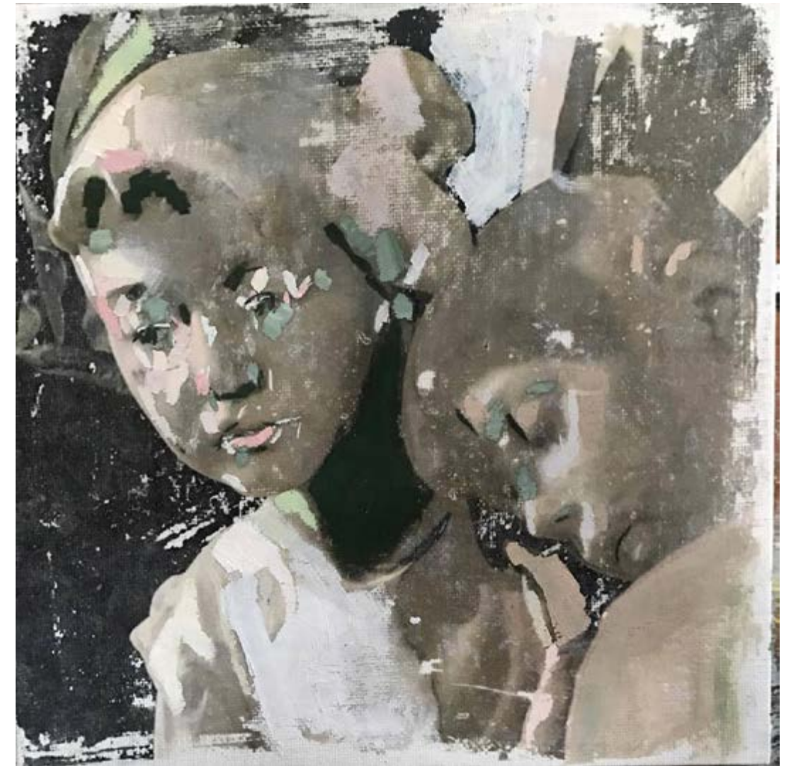
Técnica: óleo sobre transferencia fotográfica

Ilustración de Virginia Daglio Ksiazienicki