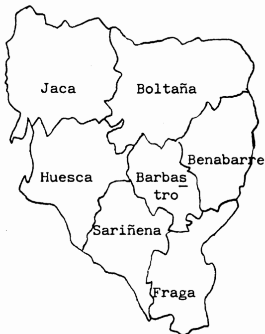
Mapa 1: Distritos electorales de la provincia de Huesca.

La provincia de Huesca, dividida en siete distritos electorales 3 , pareció ajustarse perfectamente a los deseos de los diferentes gobiernos, reproduciendo con relativa docilidad la política de alternancia de los dos grandes partidos del turno hasta 1891. No obstante, hablamos de “relativa docilidad” ya que en Boltaña, Jaca y Huesca, desde fechas muy tempranas, se establecen cacicatos estables, liberales los dos primeros, republicano posibilista el tercero, que se resisten al encasillado oficial. El resto de los distritos, especialmente el de Benabarre, se caracterizaron por su docilidad ante el juego turnista de conservadores y liberales.