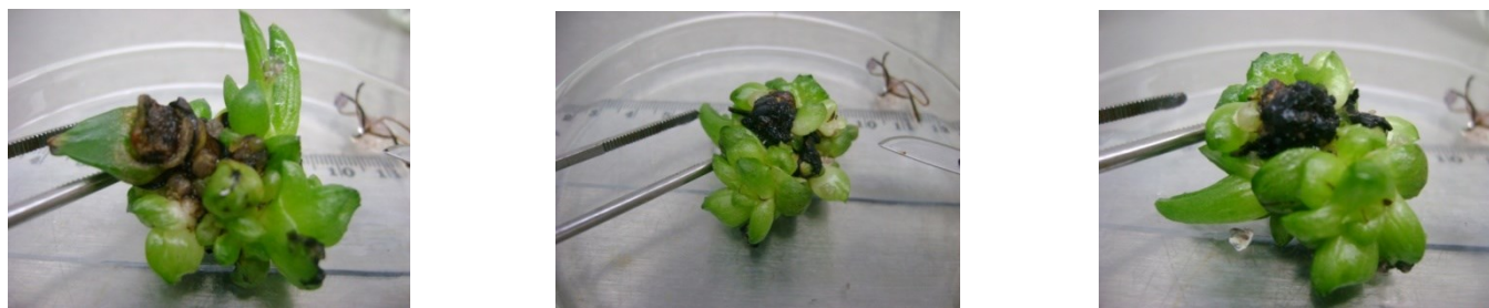
Figura 5. Apariencia de las vitroplantas de Aloe vera tratadas con colchicina a una concentración de 0,15%.

En el tratamiento de colchicina al 0,15% por 48 horas (T 7 ) se observó que las células del tejido radical fueron quimeras con un alto predominio de células poliploides (91,7%) sobre células diploides y al aumentar el tiempo de exposición a 72 horas (T 8 ), el estudio microscópico reveló que todas las células fueron poliploides. Al evaluar el desarrollo de estas plantas en cultivo in vitro , se notó que la emisión de brotes fue anormal y presentaron tallos y hojas muy engrosadas y en forma de rose-