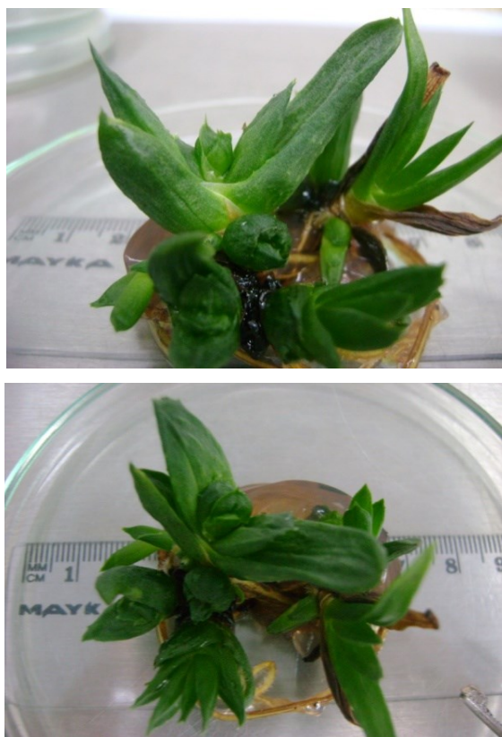
Figura 4. Apariencia de las vitroplantas de Aloe vera con tejido quimérico.

poliploides con el T 6 fue mayor que con el T 5 . Las plantas con tejido quimérico en condiciones in vitro , presentaron hojas más anchas y engrosadas y un color más intenso con respecto a las plantas controles (figura 4).