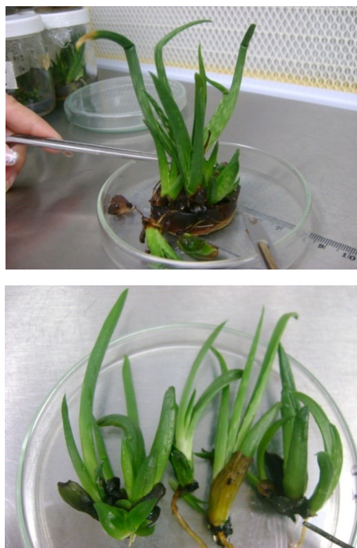
Figura 3. Apariencia de las vitroplantas de Aloe vera diploides ( 2n=14 ).

Cuando se empleó la solución de colchicina a una concentración de 0,10% por 48 y 72 horas, se logró la duplicación cromosómica en más del 50% del tejido de la planta (T 5 = 69,4% y T 6 = 78,7%) y exhibieron tanto células diploides ( 2n=14 ) como poliploides, es decir fue tejido quimérico. Sin embargo, la cantidad de células