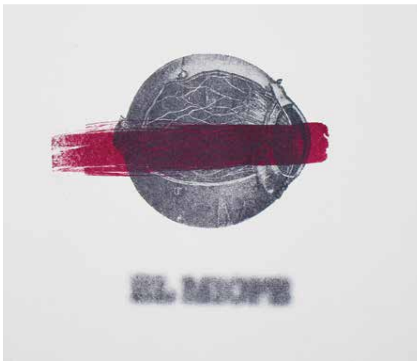
El miope (2017). Litografía en placa de offset: Fernando Chacón-Meza. Prohibida su reproducción en obras derivadas.