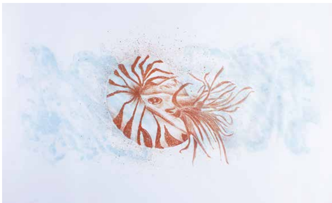
Nautilus (2016). Litografía sobre mármol: Fernando Chacón-Meza. Prohibida su reproducción en obras derivadas.