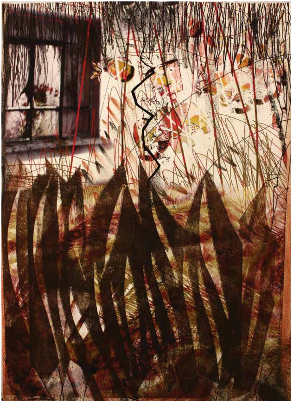
Vecinos (2016). Grabado en relieve, impresión digital, pastel, tinta china: Luis Arellano. Prohibida su reproducción en obras derivadas.