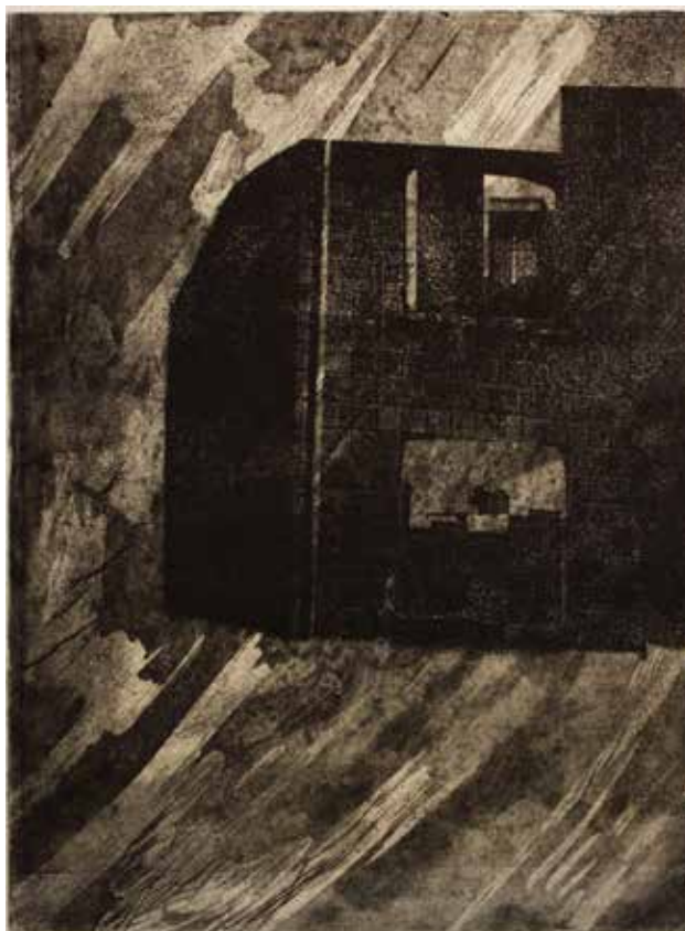
Gallinero (2017). Huecograbado y litopapel: Luis Arellano. Prohibida su reproducción en obras derivadas.