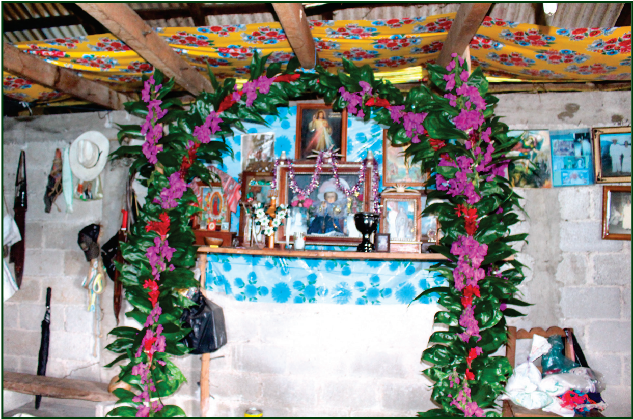
Figura 4. Altar que funciona como intermediario entre Puchina y mapakxina .

una fractura. Esto significa que el agua caliente funciona como desinflamatorio, pues controla las molestias o posibles dolores producidos en el momento de sobar a los pacientes.