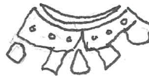
Fig.7: - Modelo C1

2- Todos los ejemplares conocidos de 1653 presentan en anverso el valor 8 formado por dos 0 unidos (Figura 8), mientras que la serie 1618/1624 con valor en anverso es una S cerrada (Figura 9) ó un 8 pequeño y cerrado (Figura 10).