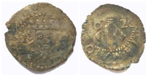
Fig.4: - 1620 - 17,5mm - 1,95 gr.