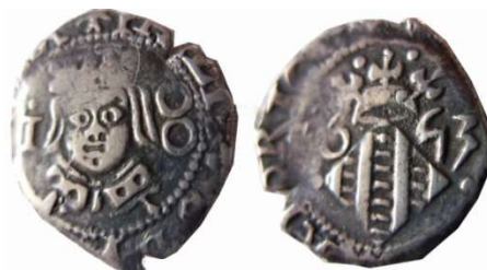
Fig.8: Ejemplar del año 1653. FMS. 8 en anverso formado por dos O unidos

2- Todos los ejemplares conocidos de 1653 presentan en anverso el valor 8 formado por dos 0 unidos (Figura 8), mientras que la serie 1618/1624 con valor en anverso es una S cerrada (Figura 9) ó un 8 pequeño y cerrado (Figura 10).