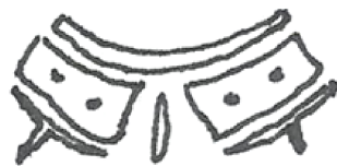
Fig.6:- Modelo F

1- El traje del busto del Rey del 53 es del tipo F (Figura 6) 7 , mientras todas las monedas de 1618 a 1624 con valor en anverso son del tipo C1 (Figura 7) 8 , como podemos ver en esta moneda de 1623.