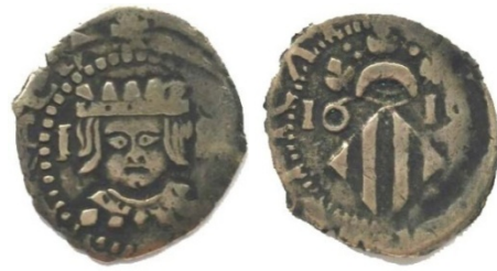
Fig.3:- 1619 - 19mm - 2,17 gr.