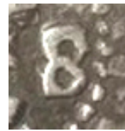
Fig.10: Numeral 8 pequeño

Por todo lo expuesto podemos afirmar que esta moneda, 1623 con valor en anverso, nos presenta dos importantes novedades: