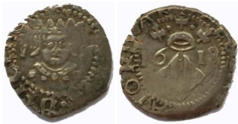
Fig.2: - 1618 - 20 mm - 2,25 gr.

Hasta el momento de la publicación de dicho artículo se conocían fechas con valor anteriores a 1640 con los años: 1618-1619-1620-1624. Todas ellas monedas de gran rareza pues se conocen muy pocos ejemplares de cada una de ellas. (Figuras: 2, 3, 4, 5). 5