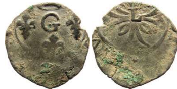
Fig. 36 Liard indéterminé entre 1653 et 1654. 13 mm et 0,44 g.