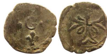
Fig. 38 Liard indéterminé entre 1653 et 1654. 12 mm et 0,59 g.