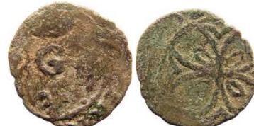
Fig. 30 Liard de 1653. 13 mm et 0,48 g.