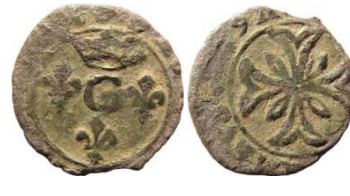
Fig. 4 Liard de 1649. 13 mm et 0,54 g.