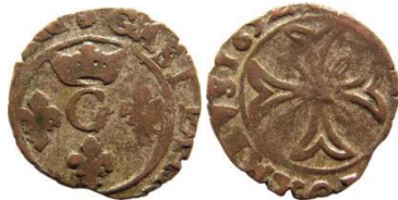
Fig. 17 Liard de 1652. 13 mm et 0,72 g.