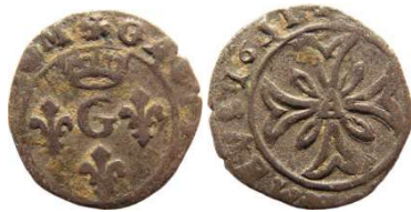
Fig. 13 Liard de 1651. 14 mm et 0,67 g.