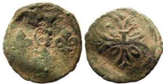
Fig. 37 Liard indéterminé entre 1653 et 1654. 13 mm et 0,48 g.