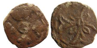
Fig. 40 Liard indéterminé entre 1653 et 1654. 12 mm et 0,46 g.