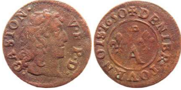
Fig. 11 Denier tournois de 1650, CGKL 762 b1. 16 mm et 1,44 g.