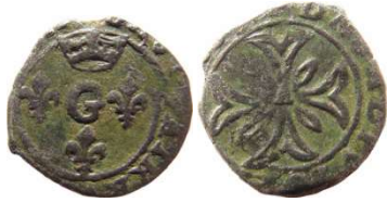
Fig. 25 Liard indéterminé entre 1650 et 1652. 14 mm et 0,91 g.