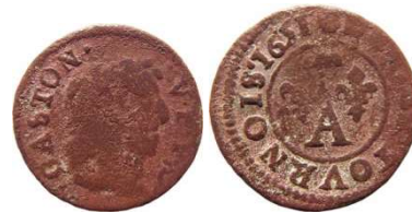
Fig. 14 Denier tournois de 1651. CGKL 762 b1. 16 mm et 1 g.