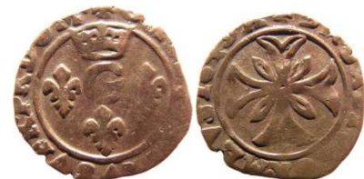
Fig. 6 Liard de 1649. 14 mm et 0,67 g.