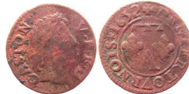
Fig. 18 Denier tournois de 1652. CGKL 768. 16 mm et 1,01 g. La rosace après le S de tournois au revers, n'est pas décrite dans le CGKL.