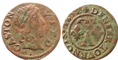
Fig. 19 Denier tournois de 1652. Variante du CGKL 768. La lettre L sous le buste et la rosace après le S de tournois au revers, n'ont pas été décrites dans le CGKL. 16 mm et 0,97 g.