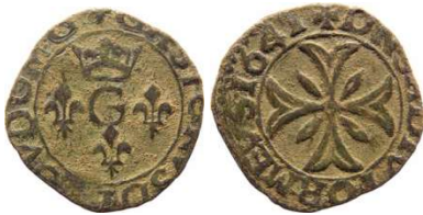
Fig. 1 Liard de 1641. 0,82 g et 15 mm.

La date 1654 marque la fin du monnayage au nom de Gaston. Anne-Marie-Louise continuera la frappe des liards en son nom de 1664 à 1679 en l'état actuel des connaissances (certaines dates intermédiaires n'ont pas été retrouvées).