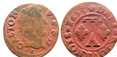
Fig. 32 Denier tournois de 1653. CGKL 768 c1. La rosace après le S de tournois au revers, n'est pas décrite dans le CGKL. 16 mm et 1,15 g.