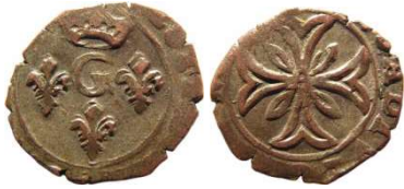
Fig. 21 Liard indéterminé entre 1650 et 1652. 13 mm et 0,75 g.