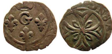
Fig. 22 Liard indéterminé entre 1650 et 1652. 13 mm et 0,54 g.