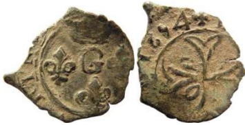
Fig. 33 Liard de 1654. 12 mm et 0,45 g.