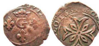
Fig. 42 Liard d'Orange pour Guillaume-Henri prince d'Orange, 1651 (Voûte n°129). 14 mm et 0,74 g.