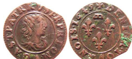
Fig. 8 Denier tournois de 1649. CGKL 756. 17 mm 1.37 g. Lettre A sous le buste dans la légende.