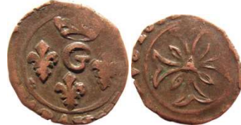
Fig. 24 Liard indéterminé entre 1650 et 1652. 13 mm et 0,73 g.