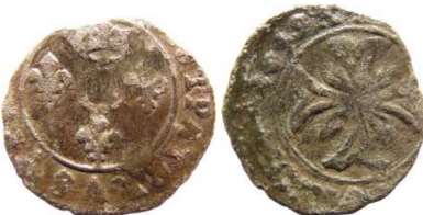
Fig. 3 Liard de 1649. 15mm et 0,46 g.