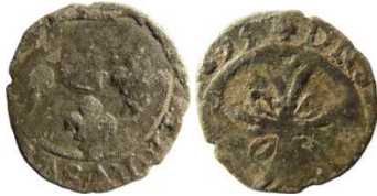
Fig. 29 Liard de 1653. 12 mm et 0,48 g.