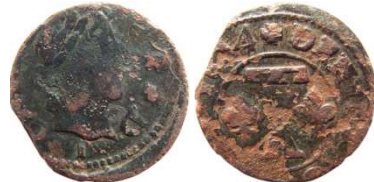
Fig. 34 Denier tournois de 1654. CGKL 768. La rosace après le S de tournois au revers, n'est pas décrite dans le CGKL. Rosace usée sur cet exemplaire. 16 mm et 1,23 g.