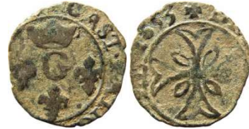
Fig. 28 Liard de 1653. 13 mm et 0,56 g.