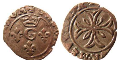
Fig. 5 Liard de 1649. 14 mm et 0,63 g.