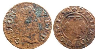
Fig. 20 Denier tournois de 1652. Variante du CGKL 768. La lettre L sous le buste et la rosace après le S de tournois au revers, n'ont pas été décrites dans le CGKL. 16 mm et 1,25 g.