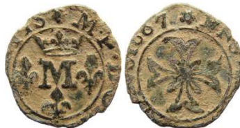
Fig. 43 Liard d'Anne-Marie-Louise d'Orléans, 1667 (Divo n°240). 14 mm et 0,55 g.