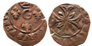
Fig. 7 Liard de 1648 ou 1649. 14 mm et 0,6 g. Date invisible mais absence de lettre au cœur de la croix.