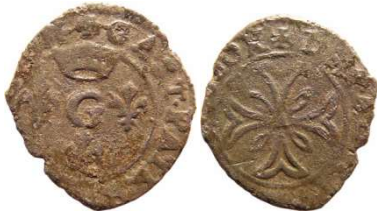
Fig. 27 Liard incertain. 15 mm et 0,66 g