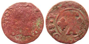
Fig. 35 Denier tournois de 1654. CGKL 768. 16 mm et 1,15 g.