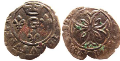
Fig. 10 Liard de 1650, 15 mm et 0,58 g.