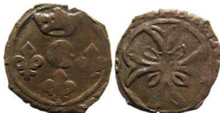
Fig. 41 Liard indéterminé entre 1653 et 1654. 12 mm et 0,5 g.