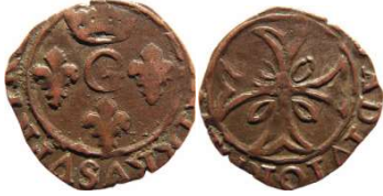
Fig. 23 Liard indéterminé entre 1650 et 1652. 14 mm et 0,56 g.