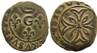
Fig. 9 Liard de 1650, 14 mm et 0,97 g.