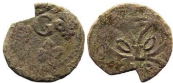
Fig. 39 Liard indéterminé entre 1653 et 1654. 12 mm et 0,38 g.