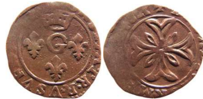
Fig. 2 Liard de 1648. 15 mm et 0,74 g.