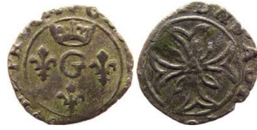
Fig. 26 Liard indéterminé entre 1650 et 1652. 14 mm et 0,5 g.