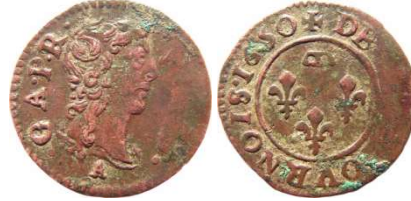
Fig. 12 Denier tournois de 1650, CGKL 760.B a1. 16 mm et 1,23 g.