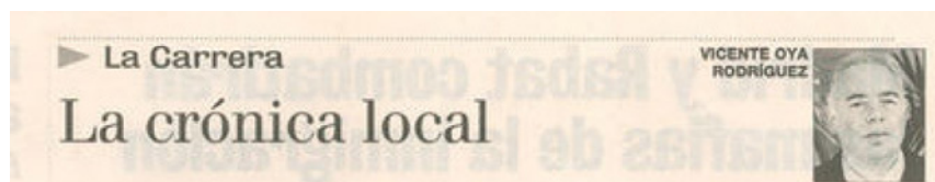
Cabecera de su Sección “La Carrera”.

Jaén, 15/VIII/2015. “Los Sucesos”, en Diario IDEAL . Jaén, 14/VIII/2015. “Y encima un Otoño caliente”, en Diario IDEAL . Jaén, 23/VIII/2015. “De los quehaceres cotidianos”, en Diario IDEAL . Jaén, 17/VIII/2015. “Cronistas de España en Jaén”, en Diario IDEAL . Jaén, 2/X/2015. “Una Real Asociación”, en Diario IDEAL . Jaén, 3/X/2015. “Muchos temas sobre Jaén”, en Diario IDEAL . Jaén, 4/X/2015. “Aires de Feria”, en Diario IDEAL . Jaén, 5/X/2015. “Nuestro variado folklore”, en Diario IDEAL . Jaén, 10/III/2016. “Hambre y sed”, en Diario IDEAL . Jaén, 9/III/2016. “Los mensajes dormidos”, en Diario IDEAL . Jaén, 6/III/2016. “Refugiados”, en Diario IDEAL . Jaén, 5/III/2016. “Santa Teresa de Jesús: Convento de Beas. Su paso por Jaén (I)” y “Santa Teresa de Jesús: Con San Juan de la Cruz. Su paso por Jaén (y II)”, escritos en su entrañable Beas de Segura y publicados en los primeros días del mes de agosto e 2016, los cuales denotan la constante actualidad de sus escritos, fruto de esa vitalidad y amor por las cosas de nuestra Provincia, para plasmarlas en su columna diaria.