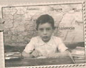
Cronista oficial de Jaén