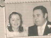
Album de fotos