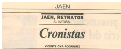
Cabecera de JAEN, RETRATOS AL NATURAL, serie periodística de D. Vicente Oya Rodríguez, para el Diario IDEAL-JAÉN.

Diario “Jaén”. “El Pregón dialogado entre el Prior y el Sochantre de Cambil”, en Diario JAÉN . Jaén, 5/IV/1985.