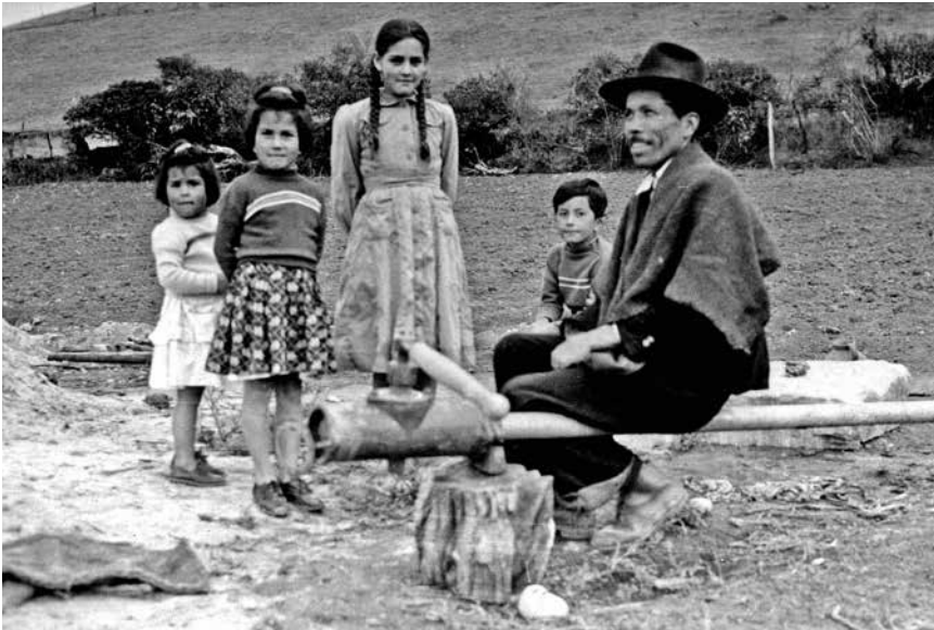
Anónimo Universidad Nacional de Colombia, Colombia, s.f. Archivo Central e Histórico Universidad Nacional de Colombia