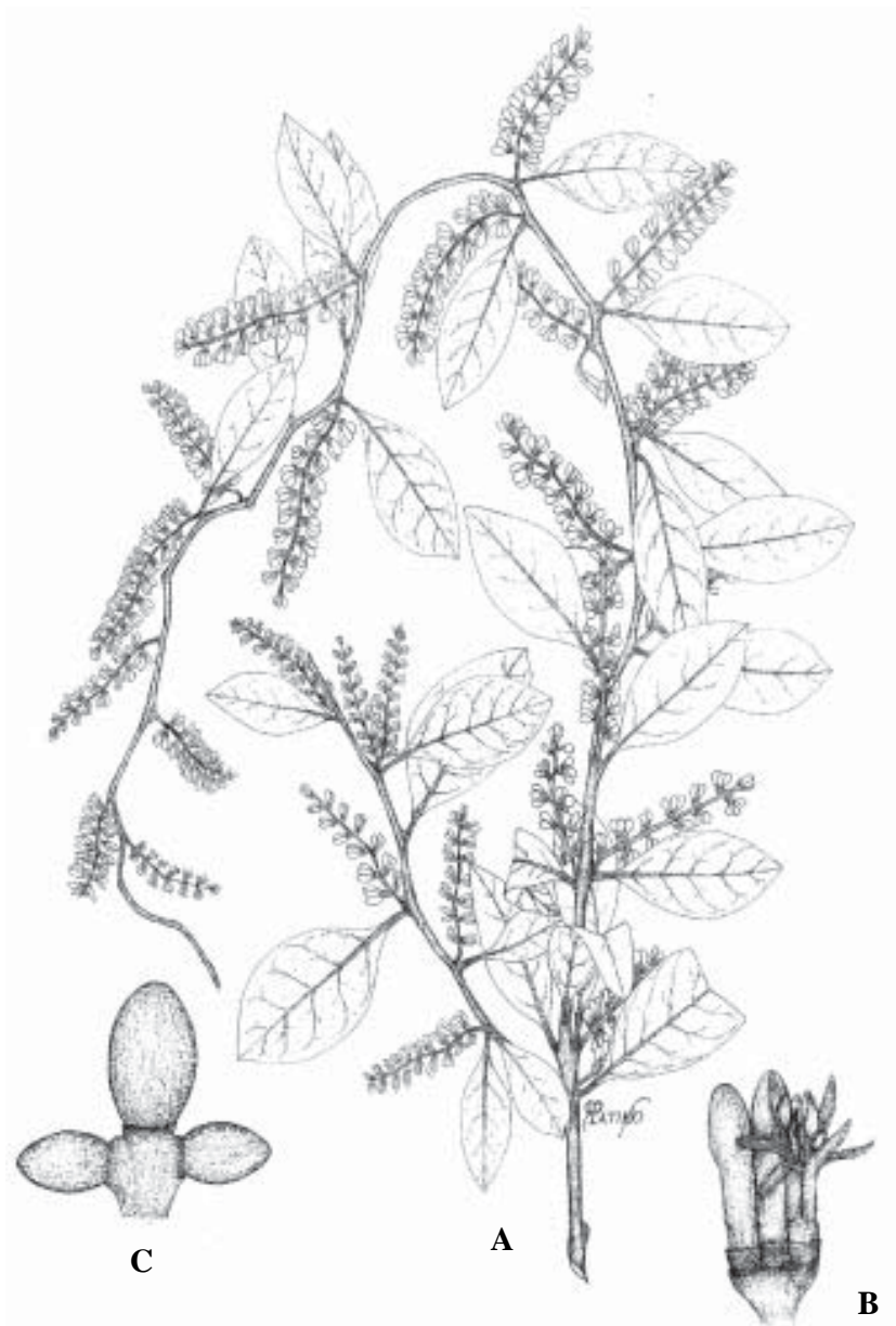
Fig. 4. Struthanthus interruptus (HBK) Bunme. A) Planta con flores (Cházaro et al. , 4773); B) Detalle de flor (Cházaro et al. , 4773) (XAL); C) Fruto (Cházaro et al. , 5898) (IEB).