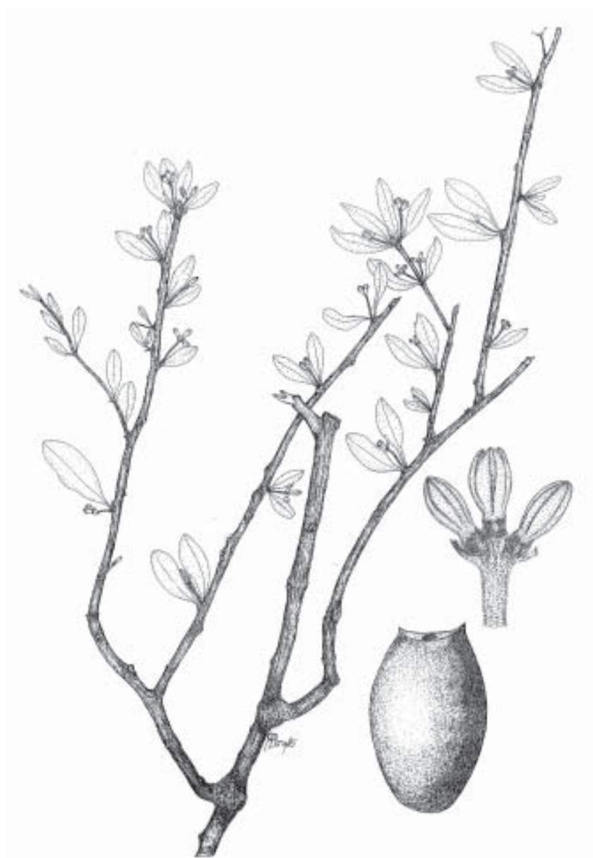
Fig. 1. Cladocolea oligantha (Standl. & Steyer.) Kuijt. A. Flor (J.A. Machuca 6543) (XAL). B. Fruto M. Cházaro B. 6482 (IEB).