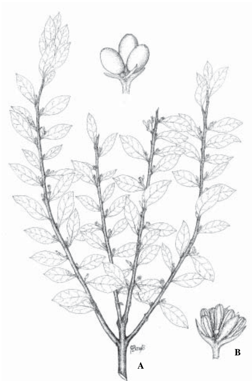
Fig. 3. Cladocolea loniceroides (Van Tieghem) Kuijt. A) Rama con frutos. M. Cházaro et al. , 4543; B) Flor. R. Ornelas et al. , 929 (XAL).