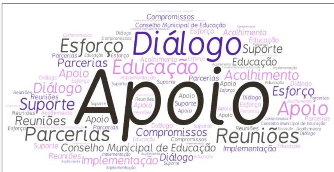
Figura 1 - Nuvem de palavras relacionadas à Categoria Apoio

A primeira categoria, denominada APOIO, retrata a percepção dos respondentes considerando as relações construídas durante a implementação do Pacto, tendo sido identificadas tanto percepções positivas envolvendo diálogo, compromissos, reuniões, parcerias com as secretarias municipais, quanto em alguns casos, em que foram relatadas situações de falta de apoio ou mesmo de pouca participação dos conselhos municipais de educação. Muitos respondentes fizeram questão de salientar a participação efetiva do gestor executivo e o esforço empreendido para a implementação do Programa e ainda o constante diálogo entre as partes em reuniões exitosas em prol dos compromissos assumidos em favor da educação. A Figura 1 reflete a árvore de palavras que constitui esta categoria.