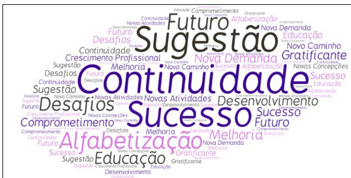
Figura 5 - Nuvem de palavras relacionadas à Categoria Desafios

Porém temos ainda muitos desafios a vencer e falhas a corrigir em 2016. (CL18, 2015).