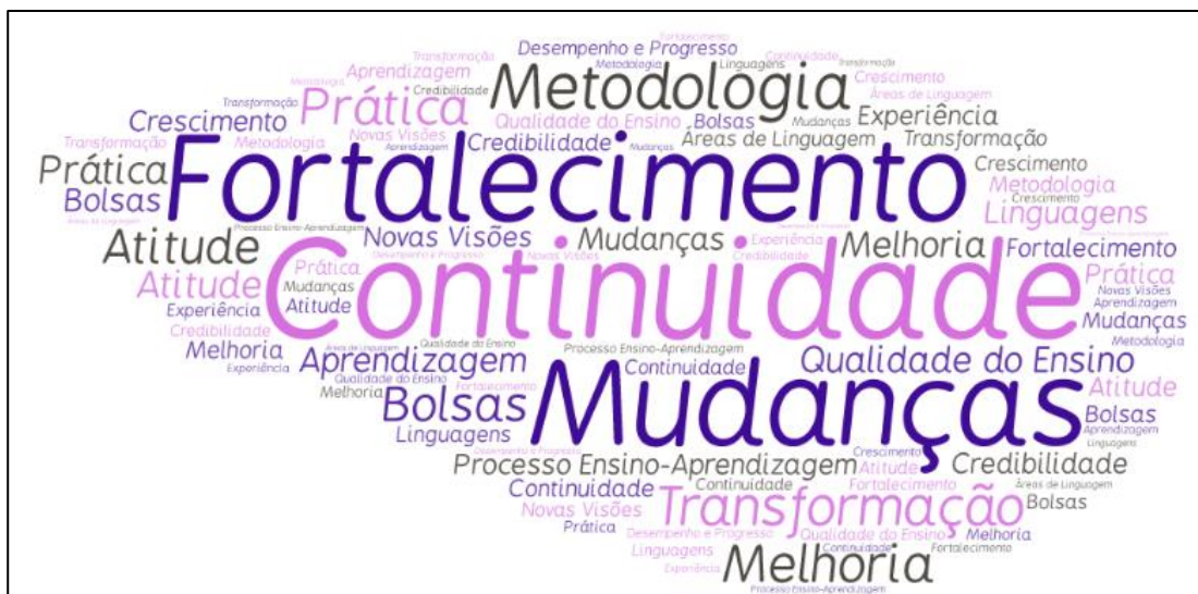
Figura 4 - Nuvem de palavras relacionadas à Categoria Mudança

A quarta categoria foi denominada MUDANÇA. Nesta categoria são incluídas as manifestações sobre melhoria na aprendizagem dos alunos, transformações nas práticas; aprendizagem dos professores e coordenadores; metodologias mais adequadas; entre outras.