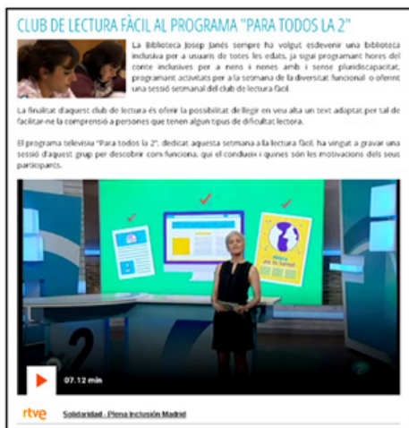
Figura 5: Ejemplo de noticia en la web de BibliotequesLH

El club de lectura fácil en castellano estuvo presente en el programa televisivo Para Todos la 2 , en un espacio dedicado a la lectura fácil y a la inclusión.