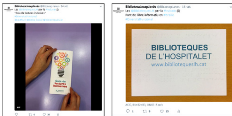
Figura 4: Ejemplo de tweets #DiversitatFuncional

Cuenta Twitter de la Biblioteca Josep Janés @bibjosepjanes . Con el hashtag #DiversitatFuncional y etiquetando a asociaciones, entidades u otros equipamientos que el contenido del tweet les pueda resultar de interés.