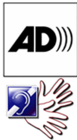
Figura 7: Pictogramas identificativos