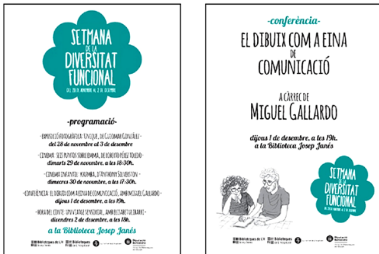
Figura 3: Ejemplos de carteles de actividades realizadas durante la Semana de la Diversidad Funcional 2016