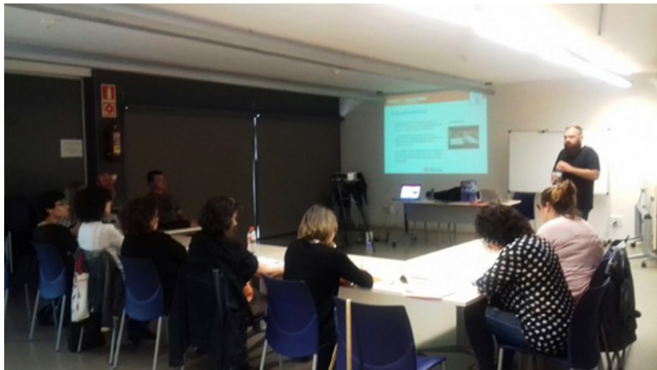
Figura 8: Sesión de formación “Trato adecuado hacia personas con capacidades diversas”