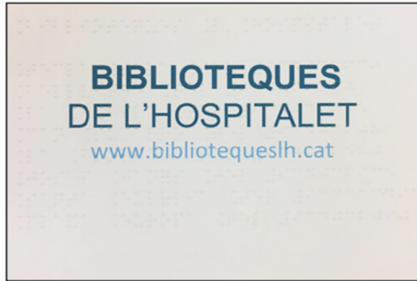
Figuras 9 y 10: Guía de lecturas inclusivas Punto de libro en braille