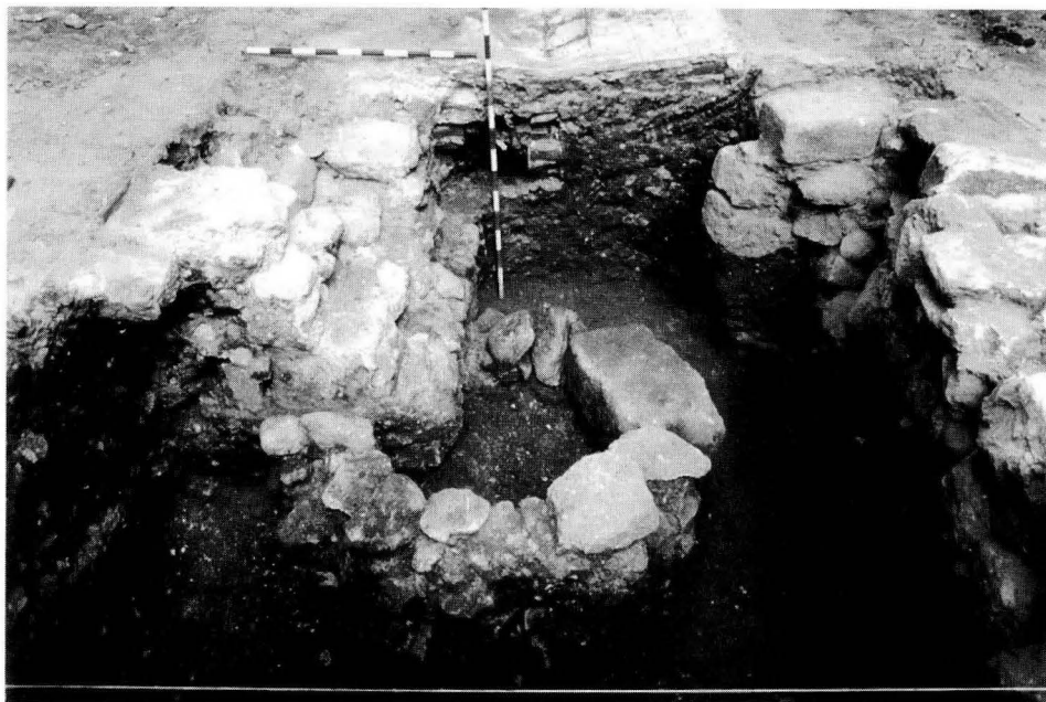
FIG. 2. Vista general de las estructuras exhumadas en el cuadro A.

recubiertas al interior con cal hidráulica, tanto el fondo como la cubierta estaban realizadas con placas rectangulares de pizarra, igualmente unidas con cal. Sus dimensiones eran 0,58 metros de anchura externa, 0,30 metros de anchura interna y 0,40 metros de altura. En su interior se había colocado un tubo de uralita que se encontraba en desuso. Para su construcción se cortó parte del muro de la vivienda (u.e. 1) formando un escalón en su cara norte.