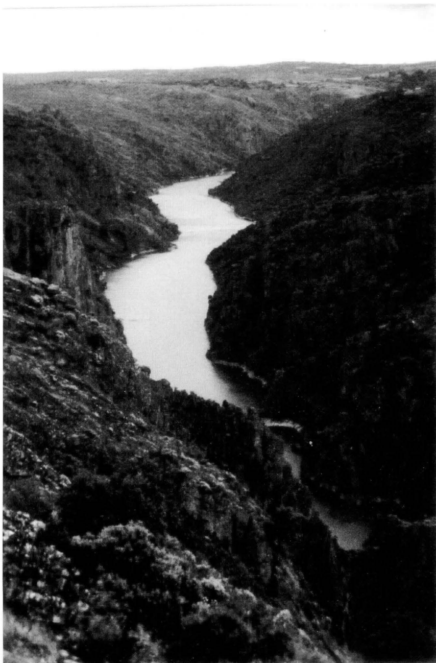
FOTO 1. Los Arribes del Duero en el término de Fariza de Sayago (1996).