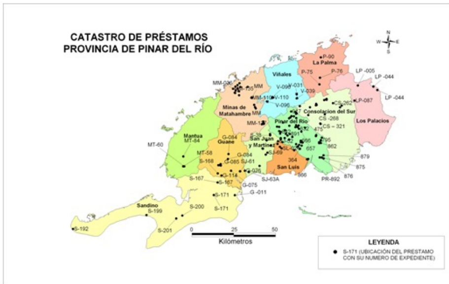
Figura 1. Catastro digital para la gestión de los préstamos de materiales de construcción de la provincia de Pinar de Río.