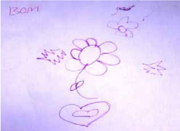
Figura 1. Coração que floresce.