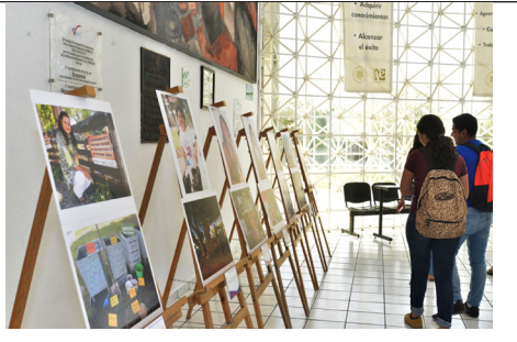
Imagen 5. Exposición fotográfica

En este sentido, la fotovoz puede entenderse como una herramienta que contribuye a la apertura de nuevos significados y a la transformación de narrativas a partir de las intermisiones entre las distintas perspectivas situadas. Esta lectura de fotovoz y de sus productos resultantes permiten redefinir el proceso de producción de conocimiento no ya como una representación fiel de la realidad (como es asumida en el planteamiento original de la técnica), sino como un ejercicio difractorio que busca producir y complejizar las perspectivas y teorías con que comprendemos los fenómenos.