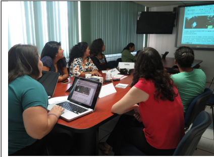
Imagen 4. Grupo de trabajo entre participantes