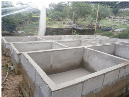
Figura 2. Estanques de cemento construidos para el desarrollo del experimento.

experimentales del estudio; de 1,5 m de largo por 1,6 m de ancho, con una altura de 50 cm, a los mismos que se le adicionó una película de agua dulce de 10 cm (Figura 2).