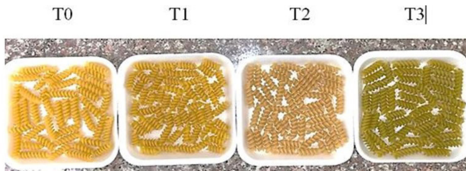
Figura 2. Imágenes de las pastas de cada tratamiento

En la tabla 3 se muestra la influencia de los diferentes tratamientos sobre los resultados del porcentaje de hinchamiento obtenido después de la cocción de las pastas alimenticias. El porcentaje de hinchamiento no presentó diferencia significativa con la muestra control con la incorporación de hasta un 30 % (T2) de almidón.