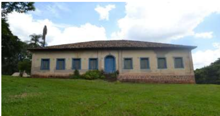
Figura 12 – Casa Sede Fazenda Cachoeira do Jica, Indaiatuba (XIX)