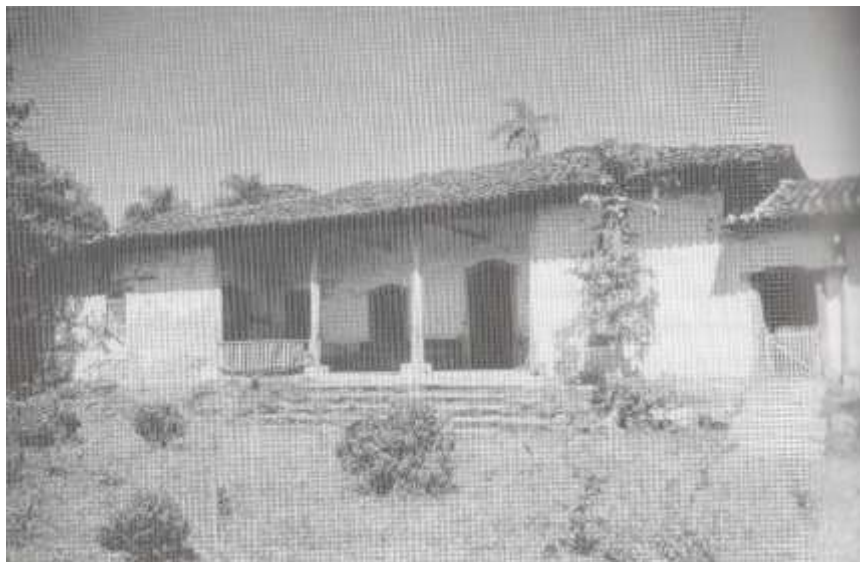
Figura 7 – Casa Sede Fazenda Chácara do Rosário, Itu (XVIII)

Essa sobreposição de culturas nos obriga a lançar mão de uma análise acurada de fontes históricas de suportes variados, ou seja, a prática historiográfica de cruzar informações da cultura material com inventários e testamentos é que torna possível identificar tais soluções arquitetônicas coloniais, fazendo-as, assim, chegar até nós como rastros da memória. Dessa forma, a partir de pequenos detalhes construtivos, diluídos em soluções arquitetônicas mais recentes, pode-se notar características das épocas bandeiristas, como alpendre aberto, paredes de taipa de pilão e a presença de capela. Tais evidências podem ser visualizadas, por exemplo, na Chácara do Rosário, em Itu, que apresenta, justamente, as variantes arquitetônicas que caracterizaram as casas dos tempos das bandeiras, como alpendre e taipa de pilão de estilo bandeirista, dialogando de forma harmoniosa, com características próprias de outros tempos, como apuro no acabamento da carpintaria, detalhes plásticos, decorativos e não apenas funcionais, como assoalho elevado do solo, base de pedra e janelas curvadas, todas características, possivelmente, trazidas por mineiros “torna viagens”.