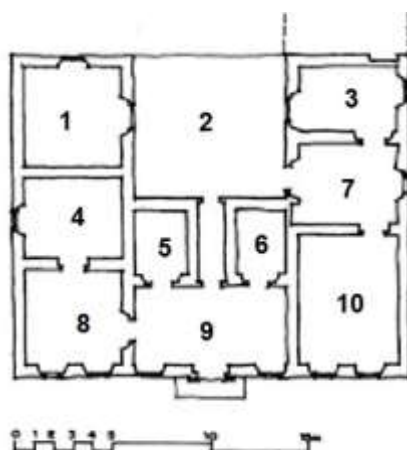
Figura 6 – Planta Tropeirista: Casa do Brigadeiro Tobias, Sorocaba (XVIII)

Fonte: LEMOS, Carlos. Casa paulista: história das moradias anteriores ao ecletismo trazido pelo café. São Paulo: Edusp, 1999, p.78