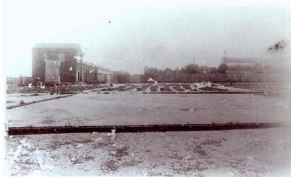
Figura 15 – Vista do terreiro e da tulha: Fazenda Pau Preto, Indaiatuba (XIX)