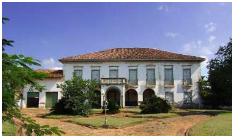
Figura 9 – Casa Sede Fazenda Paraíso, Itu (XVIII)