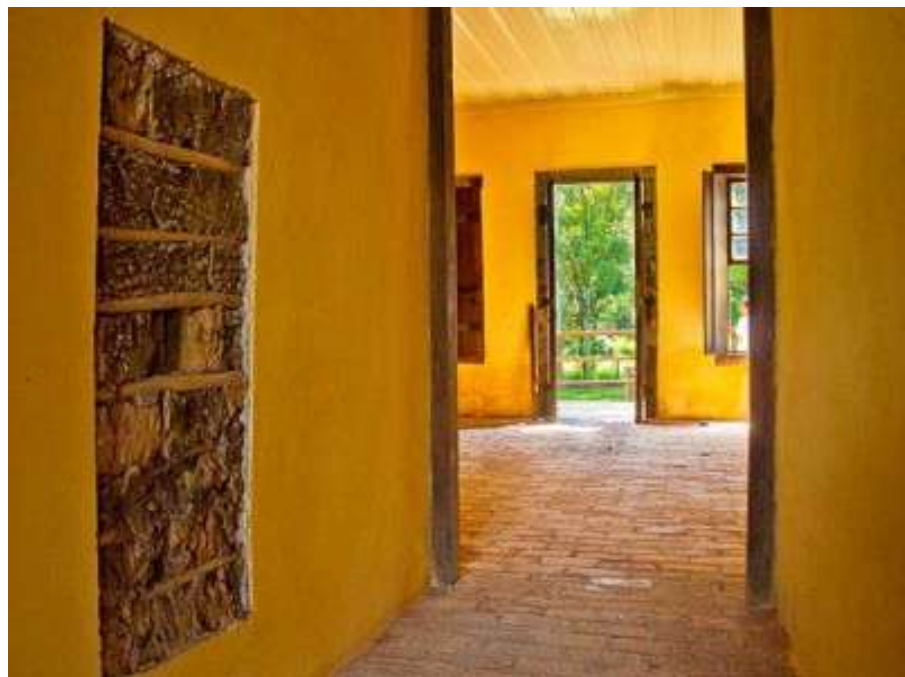
Figura 5 – Interior da casa do Brigadeiro Tobias, Sorocaba (XVIII). Alpendre fechado e pau pique nas paredes internas, características próprias de tais construções.

Fonte: Casarão Brigadeiro Tobias: Centro Nacional dos Estudos do Tropeirismo. Disponível em: http://cultura.sorocaba.sp.gov.br/casaraobrigadeirotobias/fotos/ . Acesso em 28 jul.2018