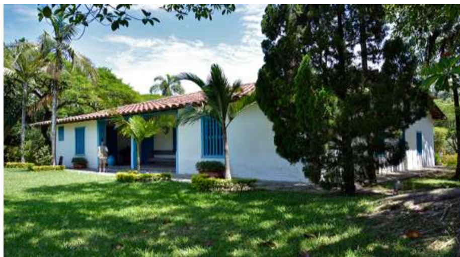
Figura 3 - Casa Sede da Fazenda Conceição, Itu (XVIII)