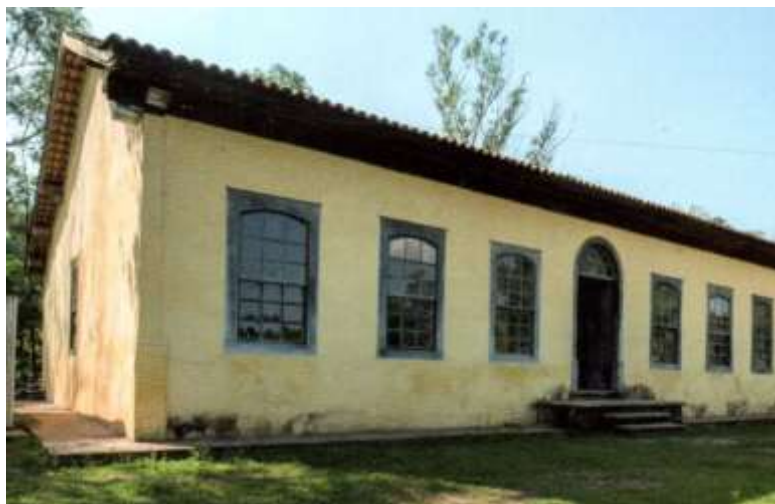
Figura 4 - Casa do Brigadeiro Tobias, Sorocaba (XVIII)