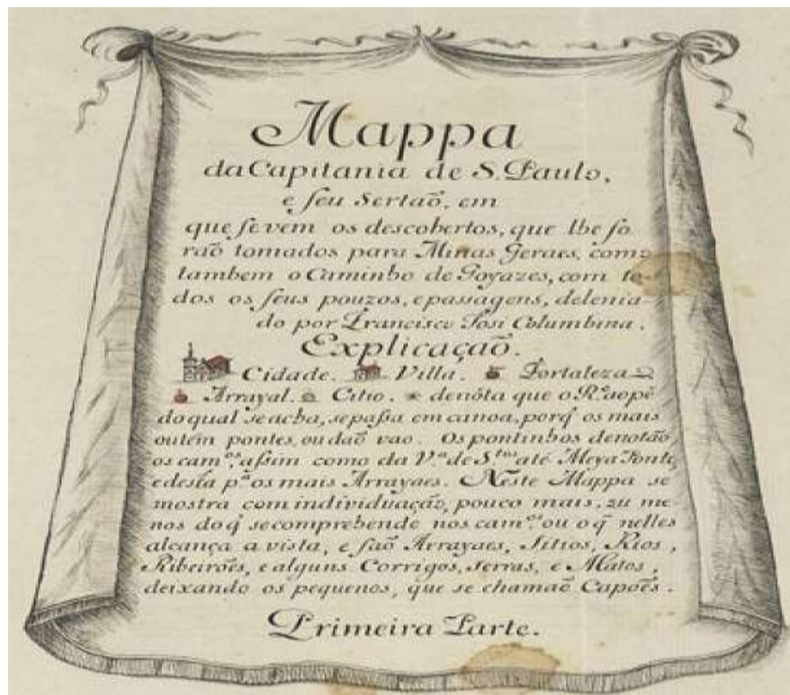
Figura 1: Legenda do Mappa da Capitania de S. Paulo e seu sertão..., de Francisco Tosi Colombina.