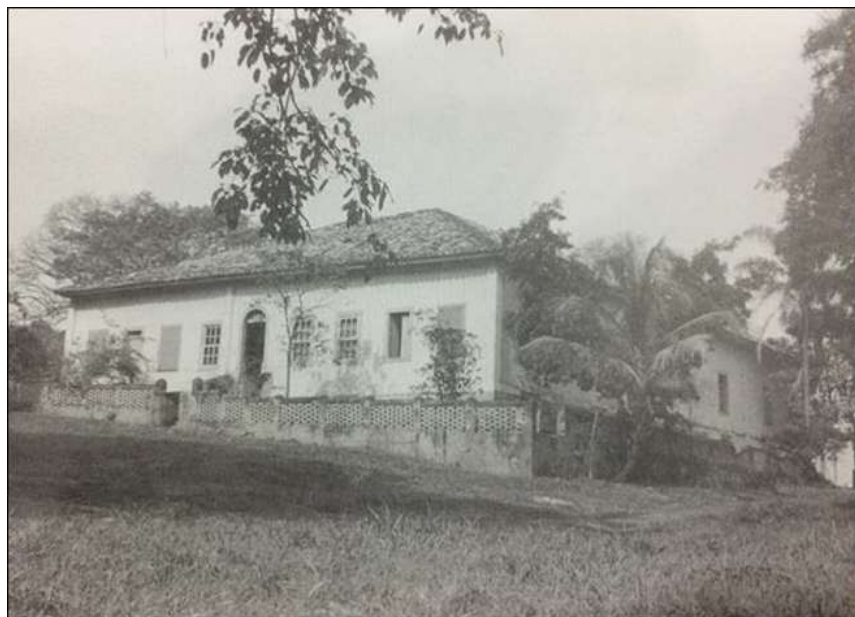
Figura 13 – Casa Sede Murada- Fazenda Cachoeira do Jica, Indaiatuba (XIX)