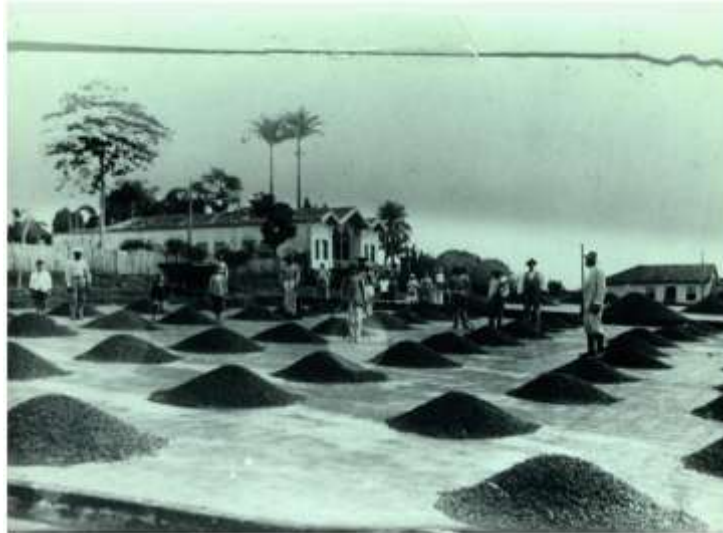
Figura 14 – Terreiros de café: Fazenda Nova União, Indaiatuba (XIX)