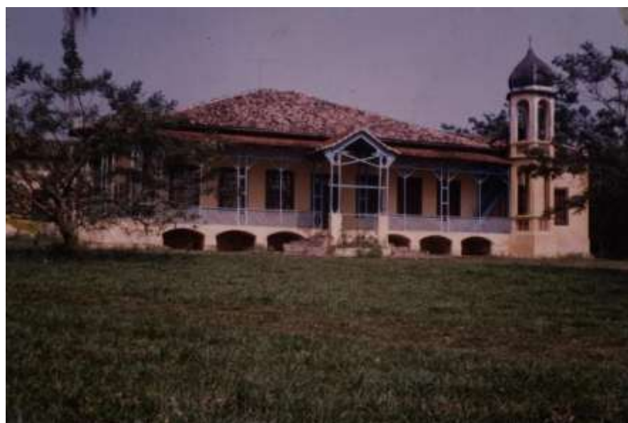
Figura 10 – Casa Sede Fazenda Taipas, Indaiatuba (XVIII)