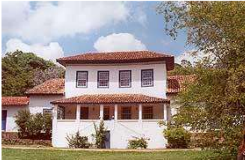
Figura 8 – Casa Sede Fazenda Pirahy, Itu (XVIII)