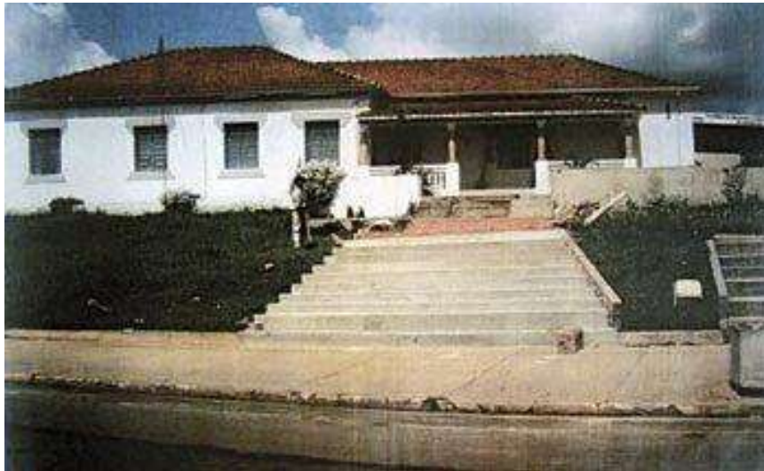
Figura 11 – Casa Sede Fazenda Engenho D'Água, Indaiatuba (XVIII)