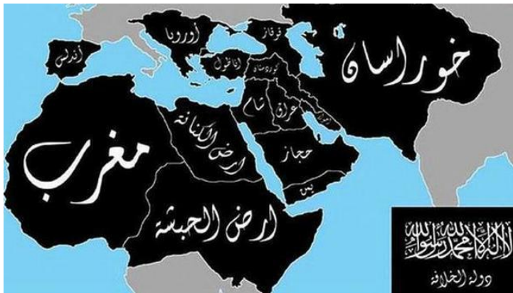
Figura 1. Mapa del nuevo califato difundido por simpatizantes del Daesh

son múltiples los atentados cometidos por la organización terrorista, siendo una parte de ellos llevados a cabo en Occidente, más allá de las fronteras que ellos mismos establecieron en este mismo año según el mapa anteriormente mencionado (véase figura 1).