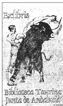
Fig. n.º 98.- Portada del libro Exlibris . Biblioteca Taurina. Junta de Andalucía.

los que se representa bajo diferentes aspectos el tema taurino. El libro viene precedido por un prólogo de Manuel Clavero Arévalo, que fue catedrático de Derecho de la Universidad de Sevilla y ministro en los últimos años de la década de los 70. También tienen carácter introductorio los dos estudios del autor, el primero sobre el origen y evolución de los exlibris y el segundo sobre el toro en los exlibris. En el primero, además de estudiar la historia de esta modalidad de estampa grabada que indica la propiedad de un libro o biblioteca, analiza a los principales