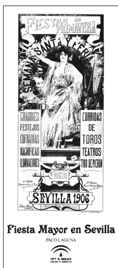
Fig. n.º 96.- Portada del libro Grandes Festejos. Fiesta mayor en Sevilla , de Paco Laguna, Junta de Andalucía, Consejería de Gobernación.

Manual práctico veterinario en los espectáculos taurinos , publicado en 1998, como los más específicos que hacen referencia a las encornaduras de los toros de lidia y sus anomalías, que han dado lugar a varias publicaciones en los años 1996, 2001, 2007 y 2011, realizadas por equipos de investigación relacionados con la Facultad de Veterinaria de la Universidad de Córdoba.