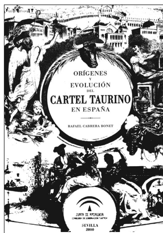
Fig. n.º 95.- Portada del libro Orígenes y evolución del cartel taurino , de Rafael Cabrera Bonet. Junta de Andalucía. Consejería de Gobernación y Justicia.

de la Consejería de Gobernación, y posteriormente de la Consejería de Justicia e Interior, de la Junta de Andalucía. Dicha Dirección General ha llevado a cabo una política de publicaciones sobre temas taurinos bajo diferentes enfoques (jurídicos, médico-veterinarios, estadísticos y divulgativos) que han dado lugar a varias decenas de títulos que son de gran interés para los estudiosos de los temas en cuestión y para los aficionados taurinos.