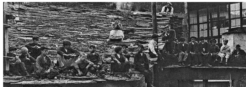
Detalle da fotografía “Homenaje a Pereira”, 1907.

Por fin, é preciso subliñar a necesidade de rescatar as identidades das xentes que aparecen nas fotos antes de que sexa demasiado tarde. Somos capaces de recuperar os espazos perdidos, pero non conseguimos poñerlles nomes e apelidos aos que aparecen inmortalizados, e a Historia trata de persoas, non de cousas: entre a masa de xente que asisten á homenaxe a Pereira non resulta posible levar a cabo a identificación dos alí presentes.