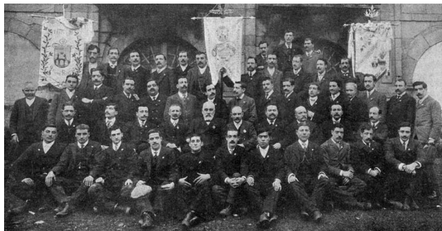
O Orfeón Gallego lucindo os tres estandartes en 1908 no claustro do edificio de Facenda da rúa da Raiña

Na década dos 90 as actividades culturais da cidade desenvolvíanse en torno a institucións de gran arraigo, como eran e seguen sendo o Círculo das Artes ou o Casino de Cabaleiros, ambos na praza Maior. Doutra banda, o Teatro Circo da rúa Castelar xunto co citado Círculo das Artes ofrecían os seus escenarios para actuacións do Orfeón Gallego que dirixido por Juan Montes alcanzara todo tipo de premios e