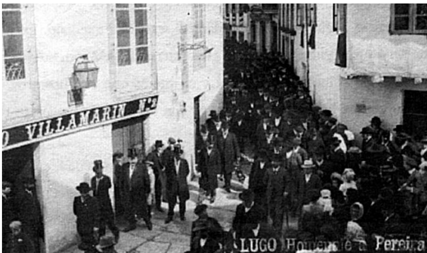
A comitiva da homenaxe a Pereira na confluencia de Armañá con Conde de Pallares, 1907

de Hoefffeld Nove, e emprendeuse de novo a marcha «[...] por la plaza del Campo, (hoy de Aureliano Pereira) 3 , calle de la Cruz, Conde Pallares y Plaza Mayor [...]» 4 .