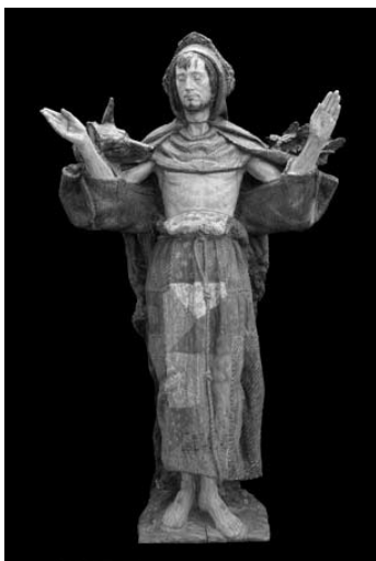
San Francisco Francisco Asorey González (Cambados, Pontevedra 1889 - Santiago de Compostela 1961) 1926 Medalla de 1.º clase na Exposición Nacional de Belas Artes de 1926. Talla en madeira policromada 186 x 114 x 50 cm N.º de Orde MPL: E-052 N.º de Rexistro MPL: 265 N.º Catálogo Museo do Prado: E00608 N.º do MNCARS: AS00366 Depositado polo Museo Nacional de Arte Moderna. Orde ministerial de 7 de febreiro de 1933