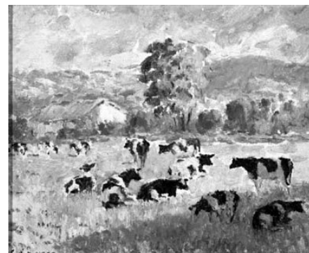
Paisaxe Gerardo de Alvear y Aguirre (Castillo de Siete Villas, Cantabria 1887- Madrid 1964) Ca. 1955 Óleo sobre tablex 37 x 45 cm N.º de Orde do MPL: P-0779 N.º de Rexistro MPL: 2013/512 N.º do MNCARS: AS01971 Depositado polo Museo Nacional Raíña Sofía por Orde Ministerial de 8 de maio de 2012.