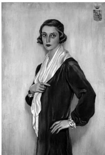
Retrato de Muller Eduardo Malta (Coviha, Centro, Portugal 1900-1967) 1929 Óleo sobre lenzo 120 x 80 cm N.º de Orde MPL: P-01014 N.º de Rexistro MPL: 2013/514 N.º do MNCARS: AS00416 Depositado polo Museo Nacional Centro de Arte Raíña Sofía por Orde ministerial de 8 de maio de 2012.