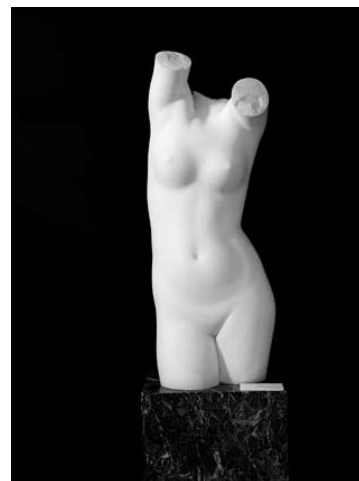
Torso de muller Jaime Otero Camps (Mahón, Menorca 1888-Barcelona 1945) Escultura en mármore 94 x 32 x 34 cm. N.º de Orde MPL: E-041 N.º de Rexistro MPL: 263 N.º Catálogo Museo do Prado: E00607 N.º do MNCARS: AS00544 Depositado polo Museo Nacional de Arte Moderna. Orde ministerial de 7 de febreiro de 1933