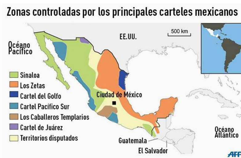
Figura 1: Geografía de los principales cárteles mexicanos