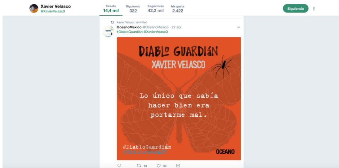
Figura 6. Captura de pantalla de un retweet de Xavier Velasco. En la imagen se aprecia el retweet del escritor sobre el promocional de Editorial Océano de su novela Diablo Guardián