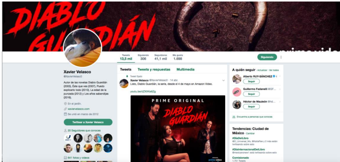
Figura 2. Captura de pantalla de la cuenta de Xavier Velasco en Twitter