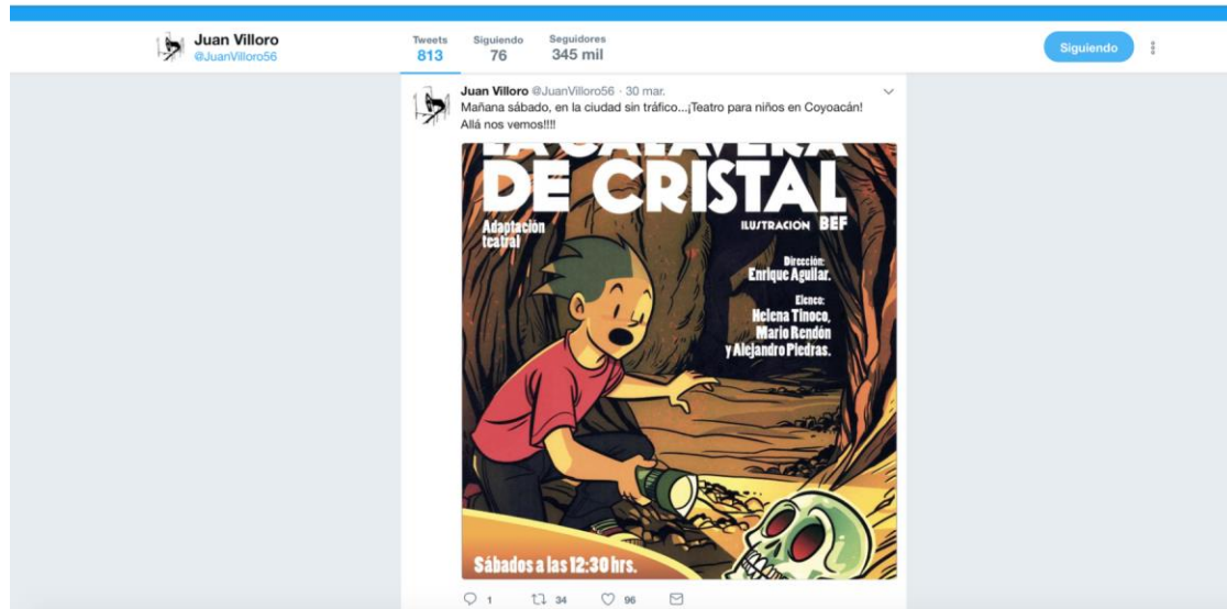
Figura 4. Captura de pantalla de un retweet de Juan Villoro. En la imagen puede observarse el retweet que realiza el escritor a un promocional de su obra de teatro

etiqueta a una serie de usuarios relacionados con el tema, específicamente al periódico y a la cuenta oficial en Twitter que promovía la candidatura independiente de Marichuy Patricio.