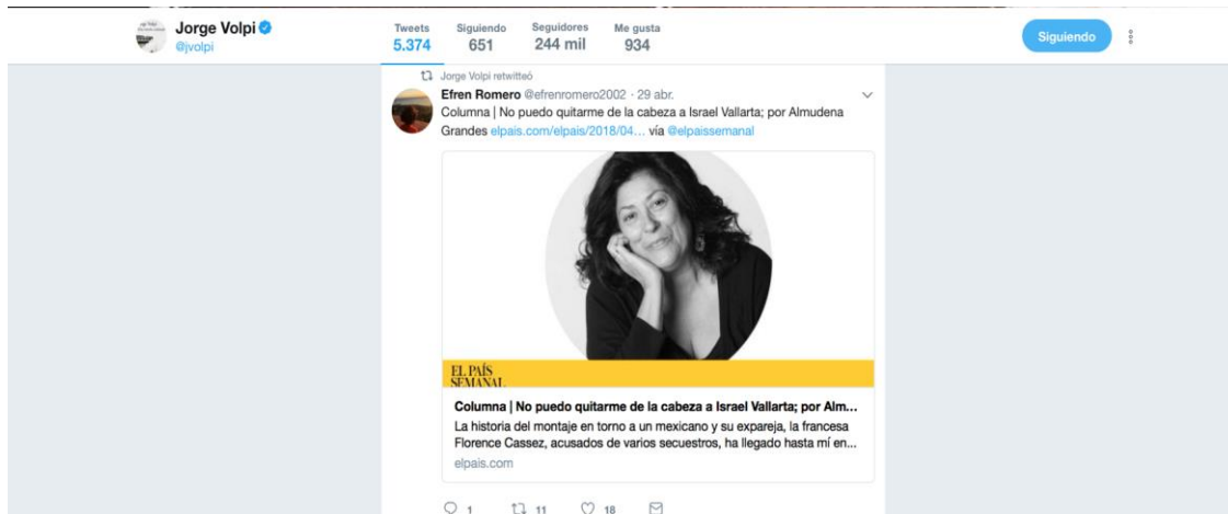
Figura 5. Captura de pantalla de un retweet de Jorge Volpi. En la imagen se aprecia la publicación que comparte el escritor sobre una reseña de Almudena Grandes, acerca de Una novela criminal , de la autoría de Volpi