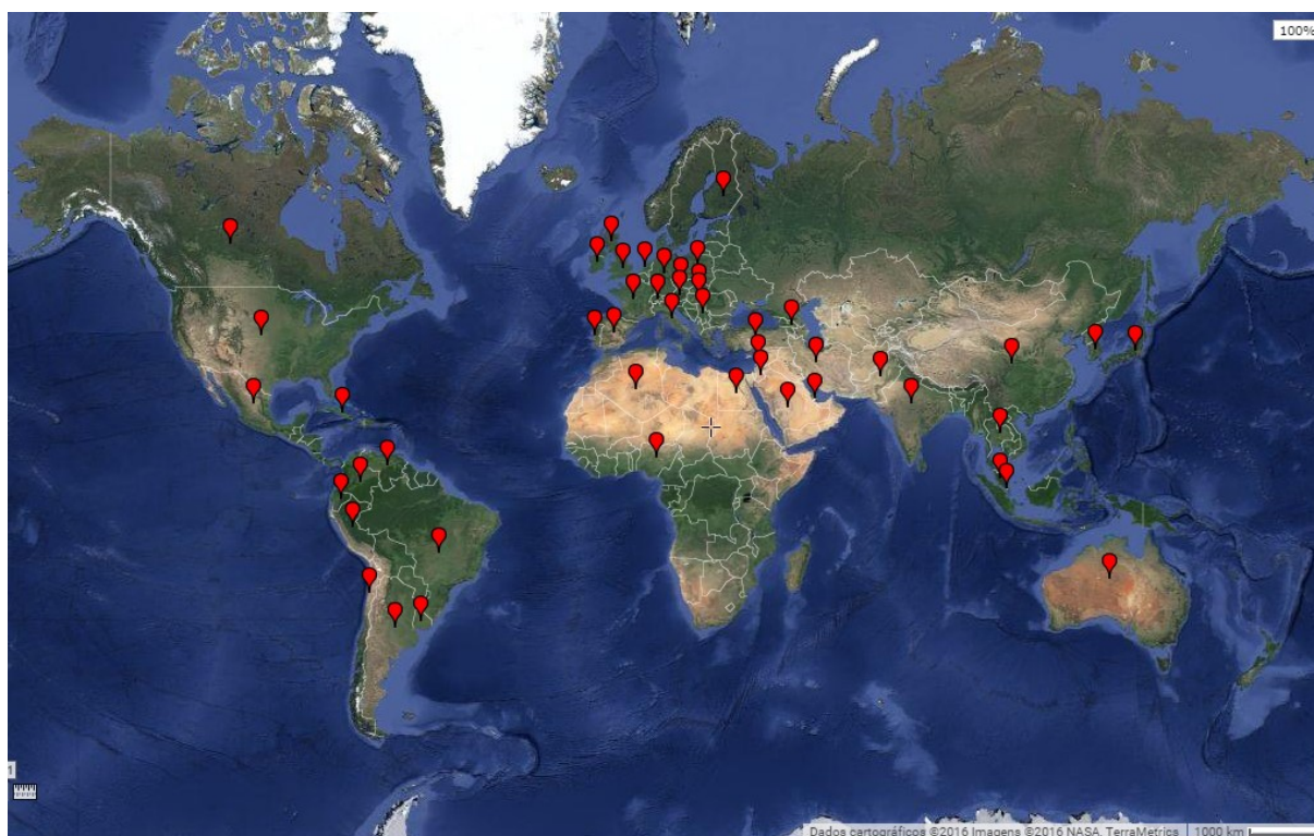
Figura 3. Distribuição geográfica dos países de origem dos autores

A Tabela 4 lista as nações identificadas indicando o número de artigos publicados em função de cada periódico, com a distinção em duas categorias, “doméstica” e “internacional”, com o intuito de diferenciar os artigos publicados apenas por pesquisadores de determinado país dos artigos publicados com pesquisadores de outros países, respectivamente. É exibido também o número de ocorrências ou autorias por cada país.