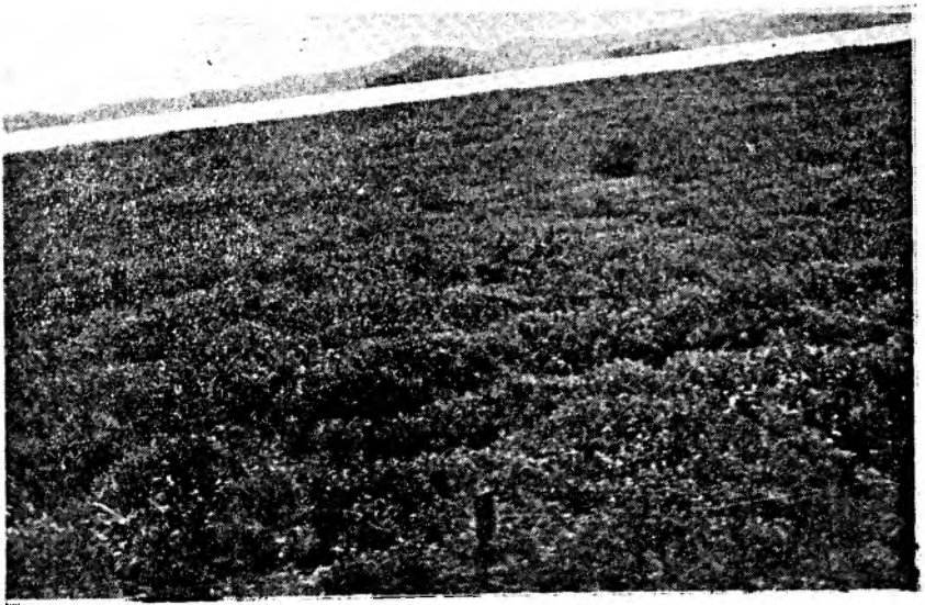
La "Hierba de rejo" ocupa extensas zonas aledañas a la laguna de Fúquene.

ta por kilogramo animal, inyectada por vía intravenosa. 3ª La dosis mínima eficaz de la planta examinada es de 0,1 a 0,2 gramos planta por kilogramo animal, inyectada por vía intravenosa. Esta dosis baja la tensión arterial, disminuye la am-