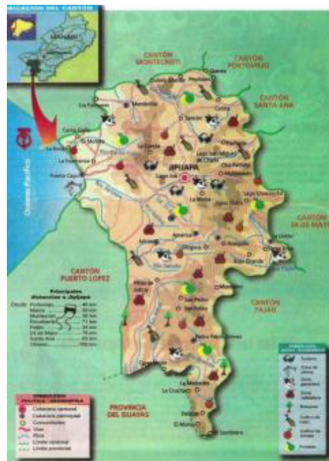
Figura 1. Situación Geográfica del Cantón Jipijapa.