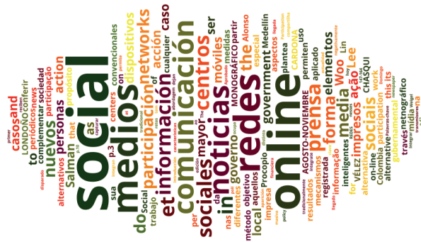
Figura 3. Nube de Tags de Londoño, Vélez y Cardona, 2015.