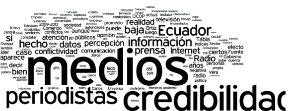
Figura 2. Nube de tags de Rodrigo Mendizabal, 2014.