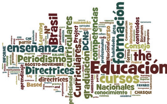
Figura 4. Nube de tags de Maranhão y Garrossini, 2015.