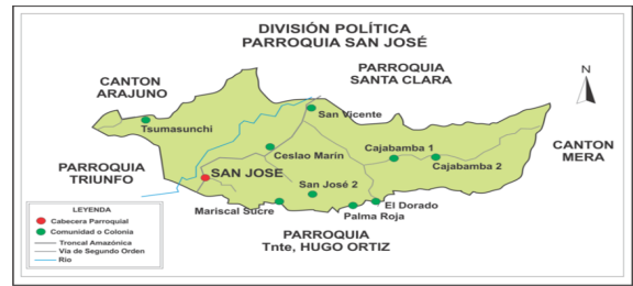
Figura 1. Mapa político de la parroquia rural San José

Una vez examinados los elementos teóricos referentes al tema abordado, los autores consideraron de suma importancia la puesta en práctica de los mismos en un caso de estudio. La investigación se realizó en las organizaciones del Gobierno Autónomo Descentralizado (GAD) de la parroquia rural San José. Este gobierno parroquial se halla integrado políticamente por nueve localidades: Cajabamba 1, Cajabamba 2, Ceslao Marín, El Carmen, La Esperanza, San José (cabecera parroquial), San José 2, San Vicente y Tsumashunchi (ver figura 1).