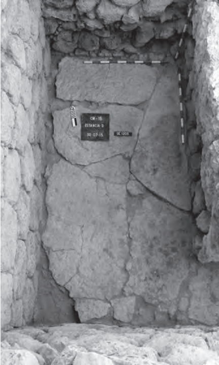
Lám. 4. Pavimentación de losetas de caliza de una estancia del Complejo Aristocrático del cerro de la Merced. Campaña de 2015.

posible acceso al interior del recinto inferior en el lado sureste de la cumbre del cerro.