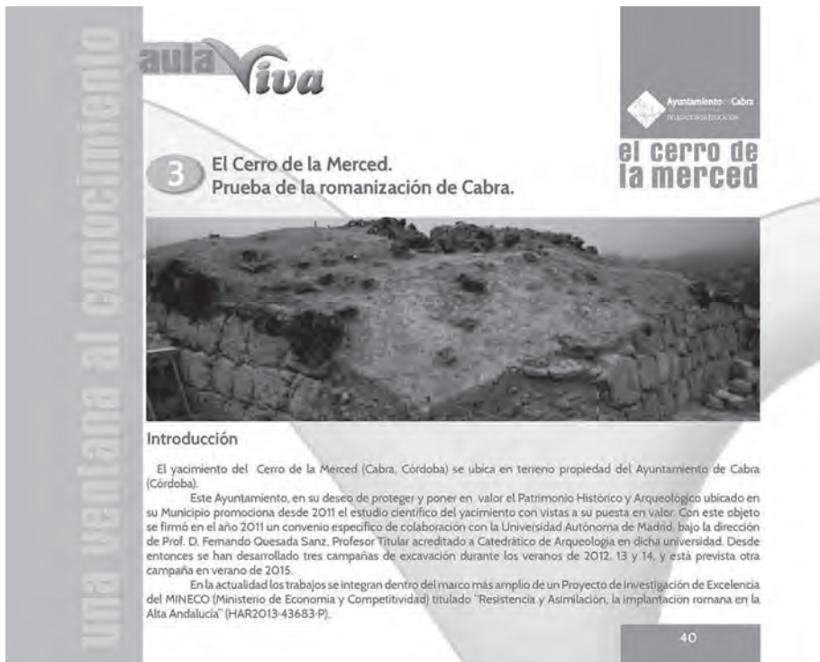
Lám. 5. Información divulgativa del programa de “Aula Viva” sobre el cerro de la Merced.

El equipo de excavación del Cerro de la Merced (Cabra, Córdoba), diri-