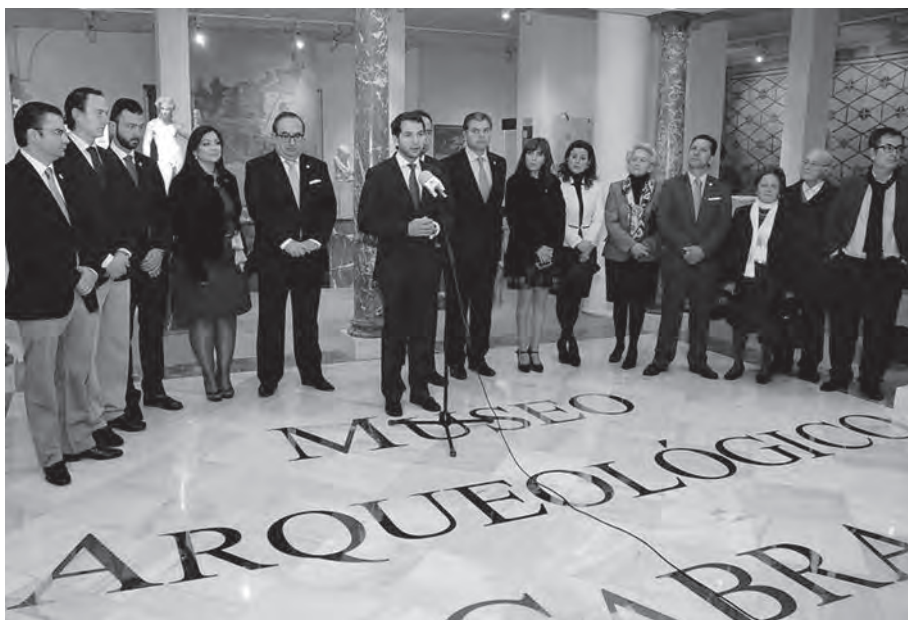
Lám. 1. Acto de reapertura del Museo Arqueológico.

tante reforma del recorrido expositivo (Plan de Modernización del Museo Arqueológico) con las obras generales de rehabilitación de la Casa de la Cultura que finalizaron en el mes de agosto de 2010. Esta compleja situación, además de las necesidades de ajuste económico por parte del ayuntamiento (Plan de Saneamiento Presupuestario), fueron las causas de