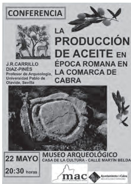
Lám. 10. Cartel de conferencia. Día Internacional de los Museos 2015.