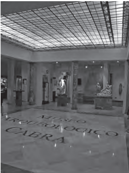
Lám. 3. Patio central del Museo Arqueológico.

También con motivo de la reapertura se programaron una serie de visitas guiadas, para grupos reducidos de 10 personas, que fueron