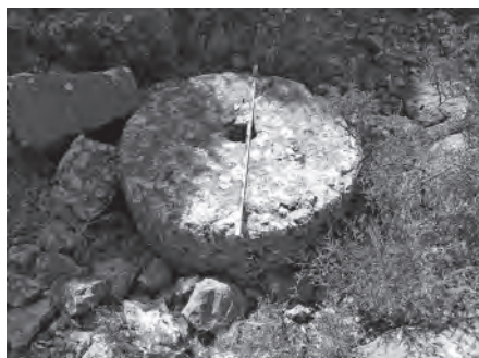
Lám. 8. Canteras de piedras de molino del Acebuchal. Sierra de Cabra.

Documentación fotográfica de un nuevo sector de las extensas canteras de la Sierra Cabra, con presencia de numerosas piedras de molino en proceso de extracción.