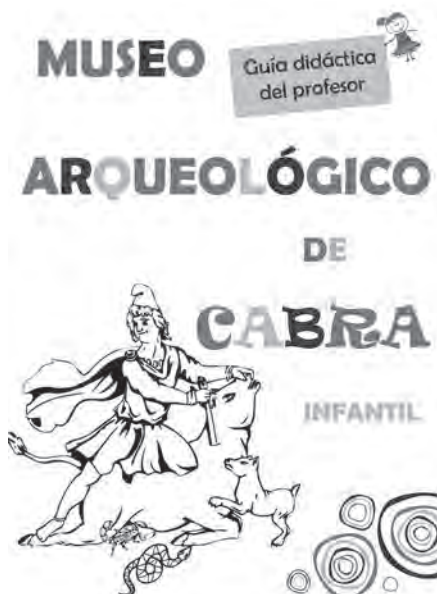
Lám. 11. Portada de la Guía Didáctica. Ciclo Infantil.