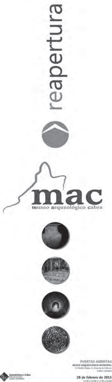
Lám. 2. Cartel editado con motivo de la reapertura.