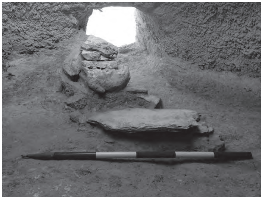
Lám. 6. Interior de la cueva artificial nº 2 de La Beleña. Campaña de 2015.