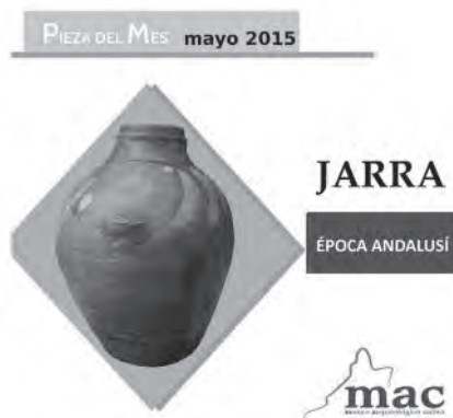
Lám. 9. Portada de la ficha de la pieza del mes.

Abril – Fragmento de escultura-fuente de Época Romana (Marchenilla).