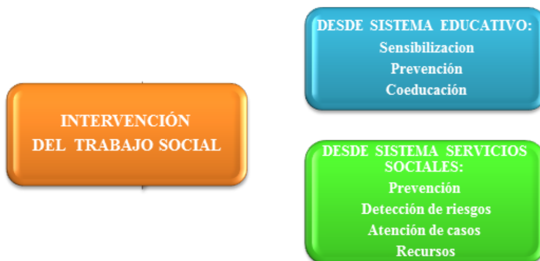
Figura 1. Intervención desde el trabajo social en materia de violencia de género.