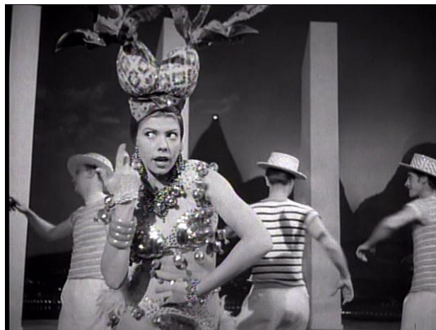
Figura 1. Ninón Sevilla en Aventurera (Alberto Gout, 1949)