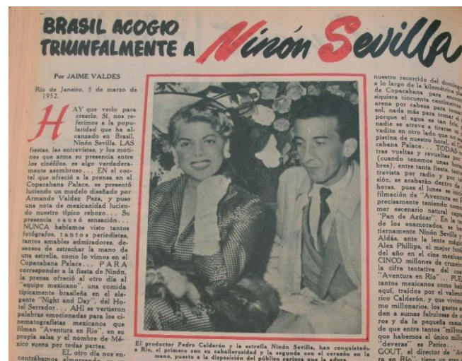
Figura 2. Recorte de la publicación mexicana Cinema Reporter , 1952.

cabaret. El show de la rumbera asume un perfil de candente entretenimiento para los asistentes, que es contrastado con la trama melodramática que se desarrolla paralelamente. Así como Nelly deslumbra en su interpretación, al mismo tiempo, detrás de escena se muestra capaz de ejecutar actos violentos, marcando cruelmente el rostro de una competidora, para luego volver a la simpatía y el fervor de la música brasileña. La ambigüedad arriba anunciada respecto a la significación de Río de Janeiro como un paraíso paradójicamente peligroso, es mantenida como motivo del filme tanto en la doble personalidad de la protagonista como en el tono de turbación mezclado con el paradigma de la “alegría brasileña” que se hace evidente en este número musical.