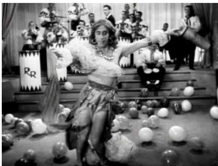
Figura 3. Oscarito, la rumbera de Aviso aos navegantes (Watson Macedo, 1950).