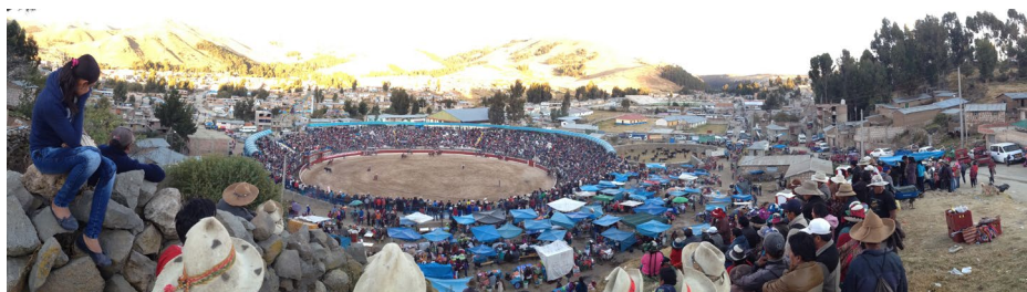
Foto 1. Vista panorámica del turupukllay o juego de los toros , corrida de toros costumbrista donde no se hiere, tortura, ni asesina al animal. Lugar: distrito de Santo Tomás, provincia de Chumbivilcas.

Dicha actividad, cuyos antecedentes se remontan a la época prehispánica, tuvo vital importancia en el Estado inca, donde se disponía de enormes hatos de llamas y alpacas que servían como transporte de carga, materia prima para productos textiles y de cuero, alimento y ofrenda ceremonial. Con la invasión hispana, se introdujeron los ganados vacuno, equino, ovino, caprino y porcino, cuyo asentamiento complementó en el espacio rural y sustituyó en el urbano las funciones que tuvieron sus antecesoras, las cuales fueron desplazadas a un segundo plano (Castro, 1999, pp. 12-14).