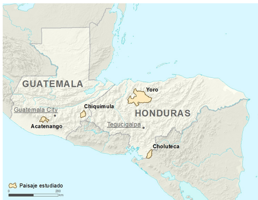
Figura 1. Ubicación de los paisajes agrícolas, dos en Guatemala y dos en Honduras, Centroamérica, donde se caracterizó el uso de prácticas de Adaptación basada en Ecosistemas (AbE) por pequeños agricultores de granos básicos. Julio 2014 - junio 2015. Figure 1. Location of the agricultural landscapes, two in Guatemala and two in Honduras, Central America, in which the use of Ecosystem-based Adaptation (EbA) practices by smallholder basic grain farmers was characterized. July 2014 - June 2015.

En este trabajo se caracterizaron las prácticas de AbE de pequeños agricultores de maíz y frijol, en un total de 160 fincas de cuatro paisajes centroamericanos: Acatenango (n=15 fincas) y Chiquimula (n=47) en Guatemala, y Choluteca (n=50) y Yoro (n=48) en Honduras (Figura 1). El área total abarcada por cada zona de estudio varió